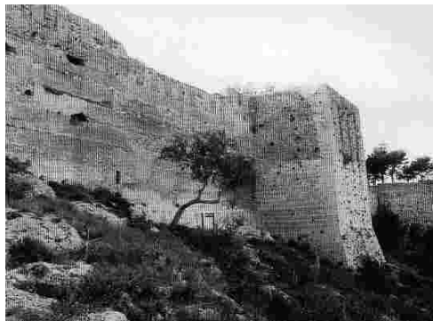
Castell de Dénia

Tradicionalment, el clergat valencià havia mantingut una intensa activitat econòmica generada per l'administració dels seus propis béns, per la gestió de benifets i altres donacions pietoses i, amb un pes determinant, per la compra i venda de censos carregats sobre propietats d'altres. Durant la guerra, aquest darrer negoci degué incrementar-se notablement, ja que l'església es convertí pràcticament en l'única institució amb capacitat creditícia, la qual cosa va fer que desenes de deniers carregaren censos –títols de deute– sobre les seues propietats per vendre'ls al clergat local, amb la qual cosa els particulars obtenien diners en efectiu a canvi del pagament d'una pensió anual a la parròquia.