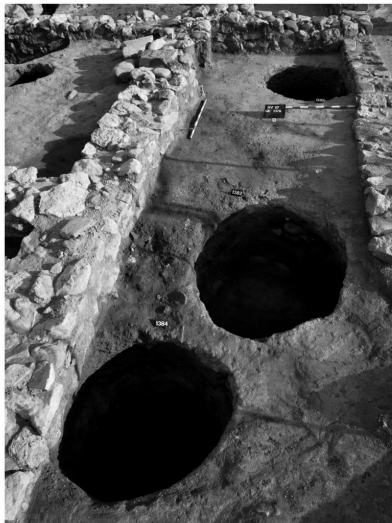
Silos tardorromanos (s. V-VI)