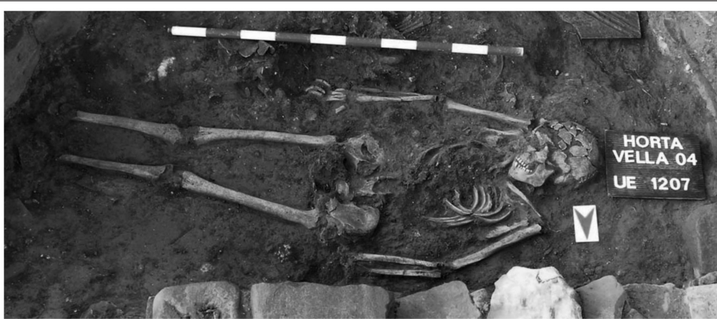
Enterramiento bajo imperial (s. IV)