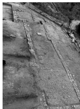
Edificio visigodo (s. VI) desde el Oeste