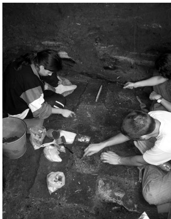
Fig. 2. Moment d'excavació de la capa 14.

similitud dels sediments com a l'absència de peces de clara adscripció a un o un altre períodes, no vam poder separar amb claredat els nivells. Degut a aquest fet, l'anomenat nivell XIV va restar com un paquet sedimentari on, tot i el domini dels materials gravetians i una datació del 21230 \pm 180 BP, hi havia algunes peces discordants que no ens permetien inscriure'l plenament al Gravetià final.