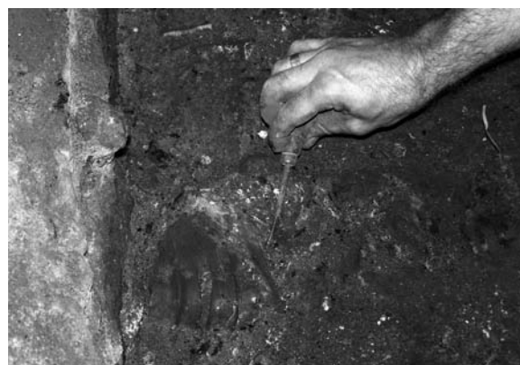
Fig. 4. Detall de l'excavació d'un metapodi d'ur ( Bos primigenius ).

A banda d'aquestes peces, que ens remetent clarament a un dels dos períodes, volem destriar la recuperació d'un bon nombre de gratadors, peces escatades (molt característiques del Gravetià de Cendres), burins i truncadures, que ens permetran estudiar amb major precisió les característiques dels moments finals del Gravetià. A nivell tecnològic cal destacar la recuperació d'un bon nombre de nuclis, suports laminars en brut i restes dels processos de preparació i condicionament que ens permetran definir els processos de talla realitzats en el jaciment.