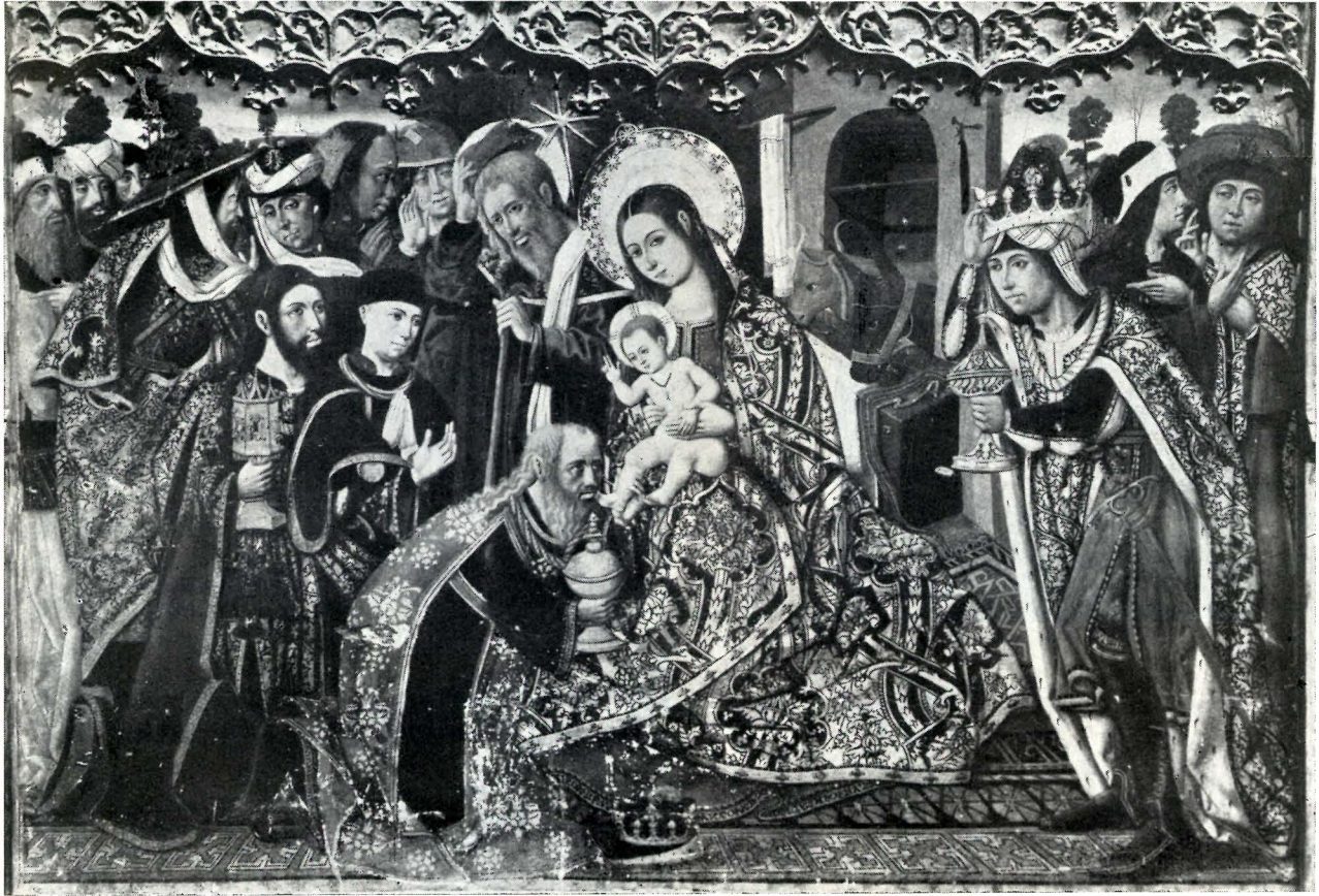
Un navidal para la felicitación de Pascuas y Año Nuevo 1954, circulado por la Facultad de Medicina de Valencia