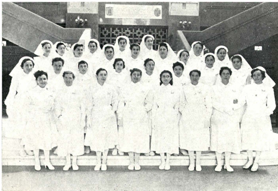
Alumnas de segundo curso, plan antiguo, que han finalizado sus estudios de Enfermera en el Curso Académico 1953-54