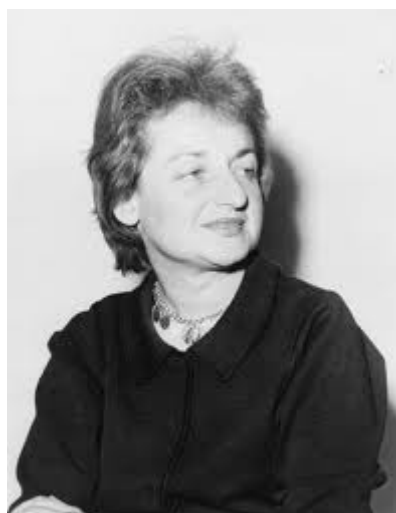
Punt 5: Clara Campoamor/Margarita Nelken/Federica Montseny