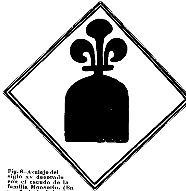
Fig. 6.-Azulejo del siglo xv decorado con el escudo de la familia Monsoriu. (En una fachada de la alquería valenciana llamada actualmente de Pontóns.)