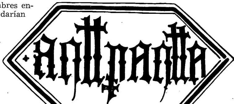
Fig. 2.—Azulejo del siglo xv, en forma de «alfardó», decorado con la divisa «Aquell per Aquella». (Con el azulejo de la figura anterior, en la fachada de una alquería valenciana.)