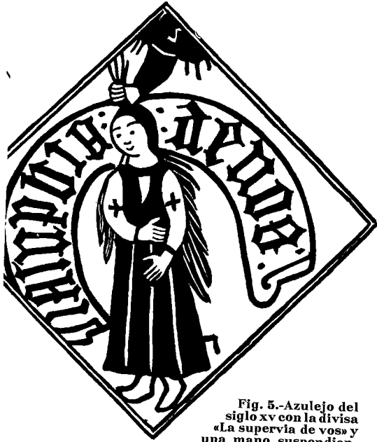
Fig. 5.-Azulejo del siglo xv con la divisa «La supervia de vos» y una mano suspendiendo de los cabellos a una dama. (En el palacio-castillo de Benisanó.)

Con el tiempo se pierde la posible verdad de estos hechos; en lugar de AMBOS, equivocadamente se lee AMBAS en aquel monumental letrero, y relacionando la divisa parlante de la mujer asida por los cabellos con el hecho ocurrido en 1525 de haber pernoctado en Benisanó el rey Fran-