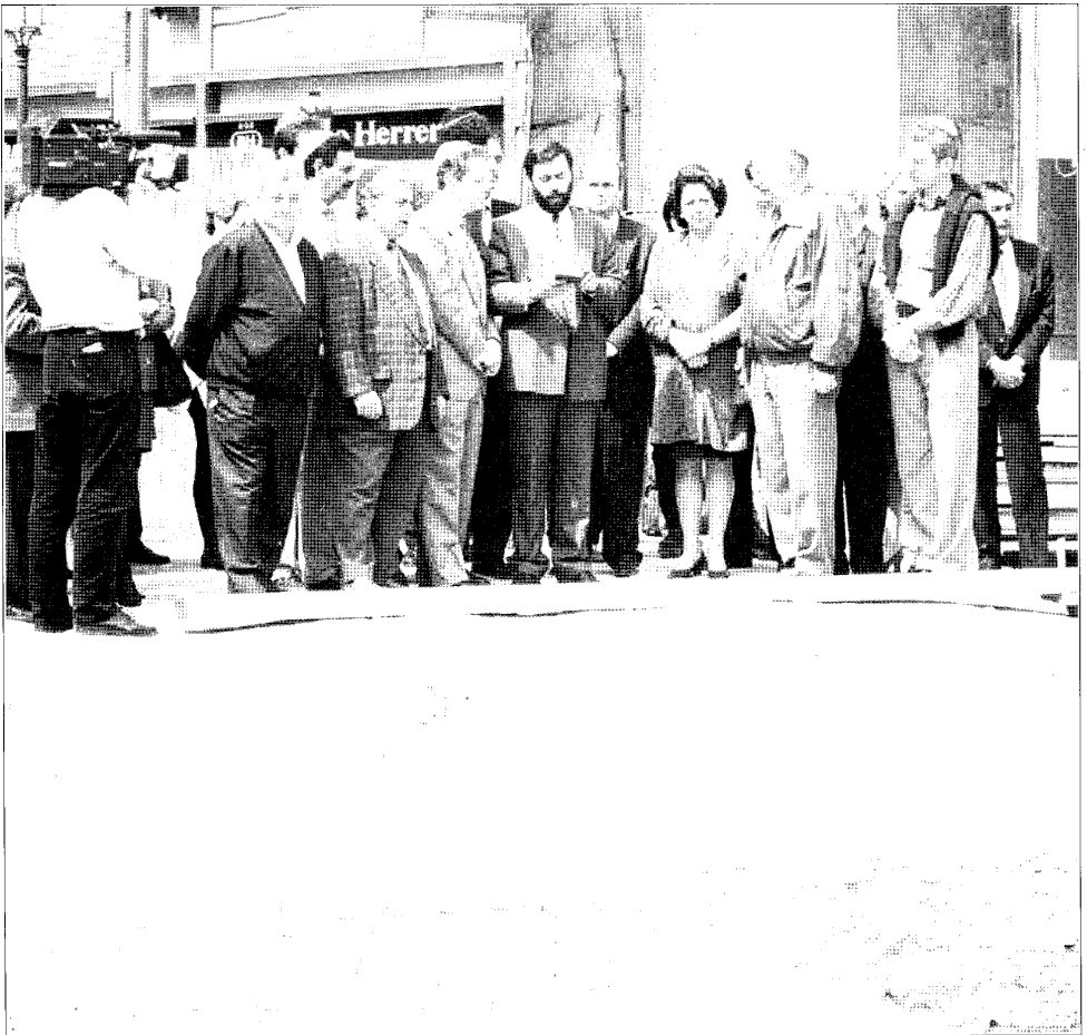
Lám. I. Ceremonia religiosa previa a la exhumación de los cadáveres de la c/ Dr. Romagosa, con la asistencia de la alcaldesa de Valencia y el entonces conseller de Cultura a la izquierda del rabino, el día 17 de Abril de 1996.