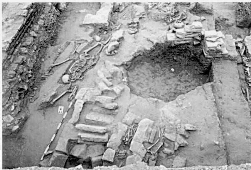
1. Vista de la necrópolis de Roterros. Tumba con cubierta de adobes.