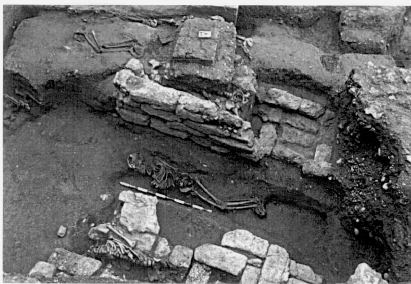
2. Tumbas construidas con bloques de yeso dispuestos a soga y tizón. Excavación Calle Juan Plaza.