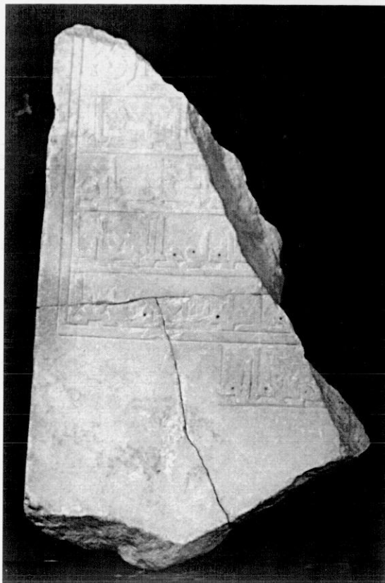
4. Lápida funeraria aparecida en la excavación de la Pl. de la Almoína.