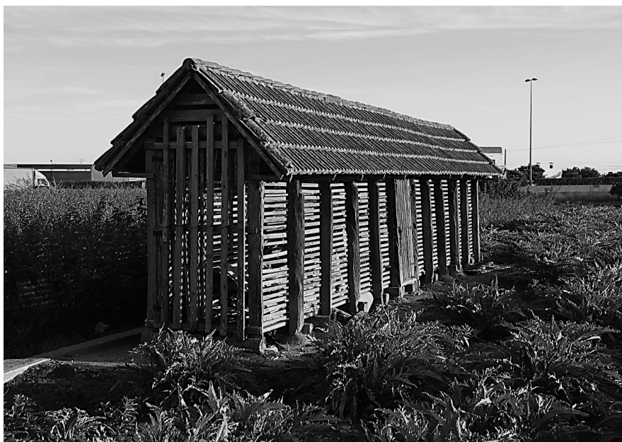
Figura 18: Cebera a l'Horta de la ciutat de València.