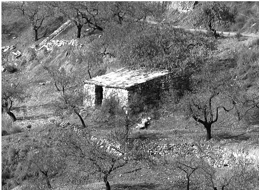
Figura 7: “Casita de monte” d’una crugia. Algimia d’Almonacid (Alt Palància).