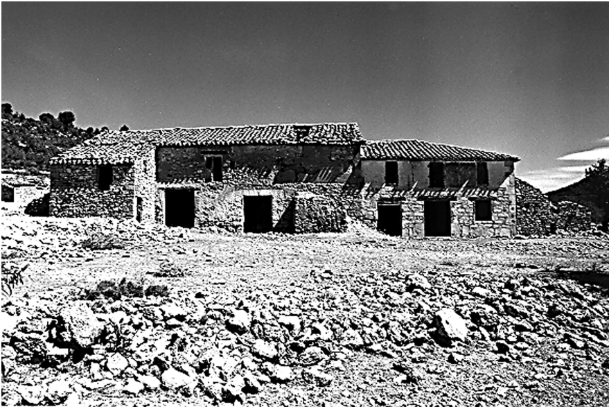
Figura 11: Mas de la Mailesa. Titaguas (Els Serrans).