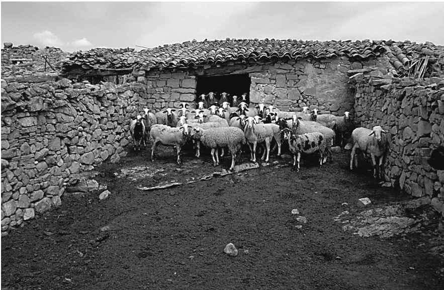
Figura 22: Corral de ramat amb espai cobert tancat amb paret. La Yesa (Els Serrans).