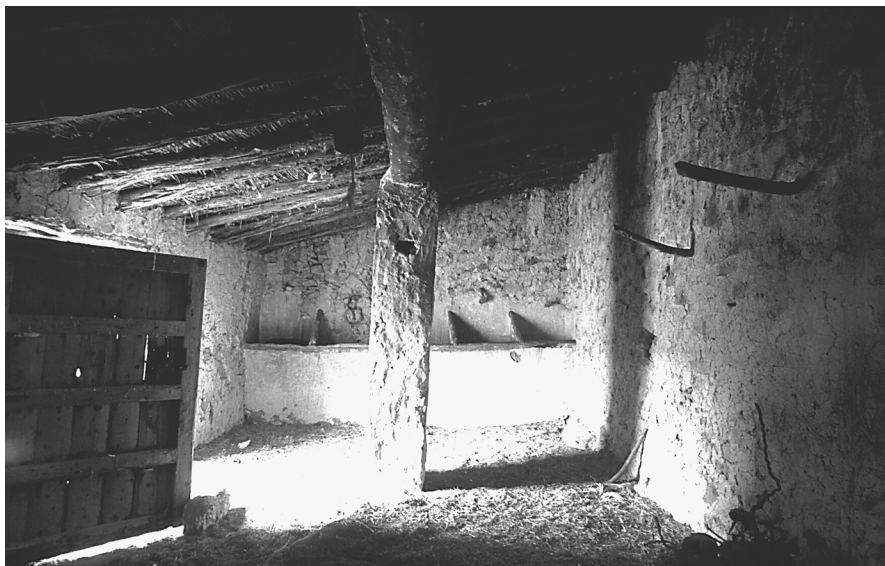
Figura 8: Espai d’ocupació animal en una casa d’una crugia. Titaguas (Els Serrans).