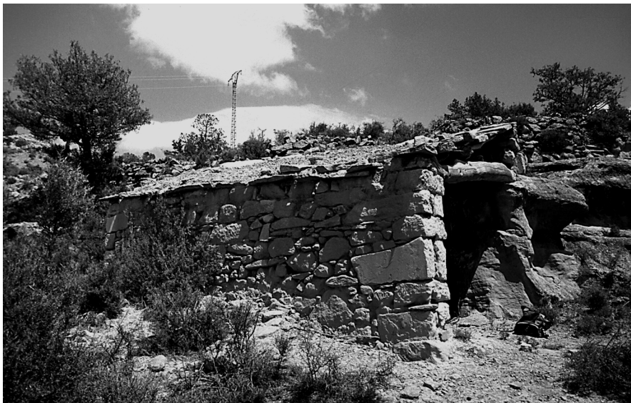
Figura 5: Refugi rural amb coberta de lloses de pedra i terra, on s'aprofita un desnivell del terreny com a paret. Alpuente (Els Serrans).