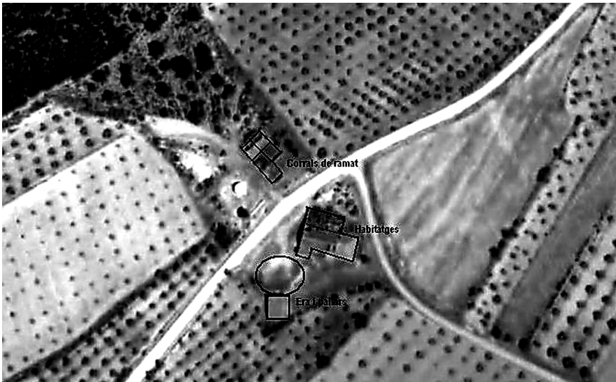
Figura 12: Mas de la Mailesa. Croquis del conjunt. Titaguas (Els Serrans).