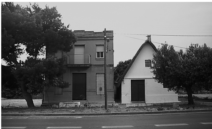
Figura 16: Barraca i la seua substitució per una casa. Pedania de La Punta, a l'Horta de València.