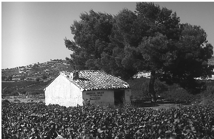
Figura 10: Caseta de secà de dues crugies. Torrent (L'Horta Sud).