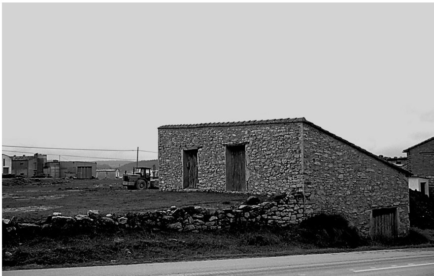
Figura 17: Conjunt d'era i pallisses. Titaguas (Els Serrans).