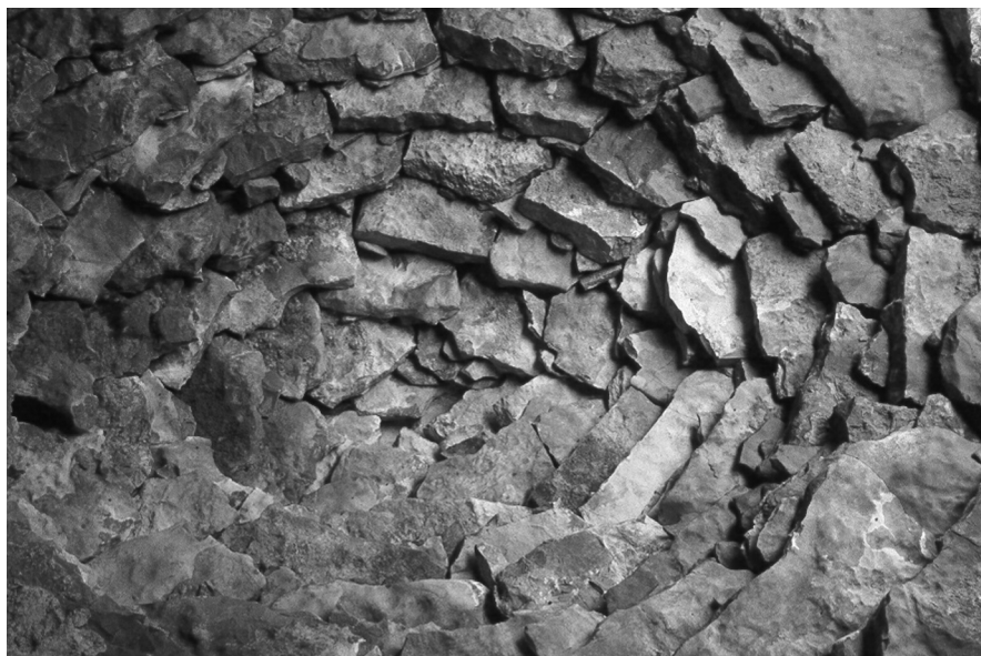
Figura 4: Volta d'una barraca feta amb aproximació de filades de pedra. Tirig (l'Alt Maestrat).