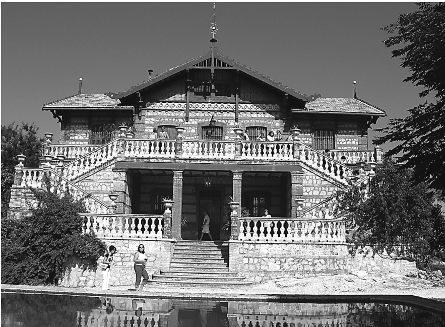
Figura 14: Hort de Batalla. Carcaixent (La Ribera Alta).