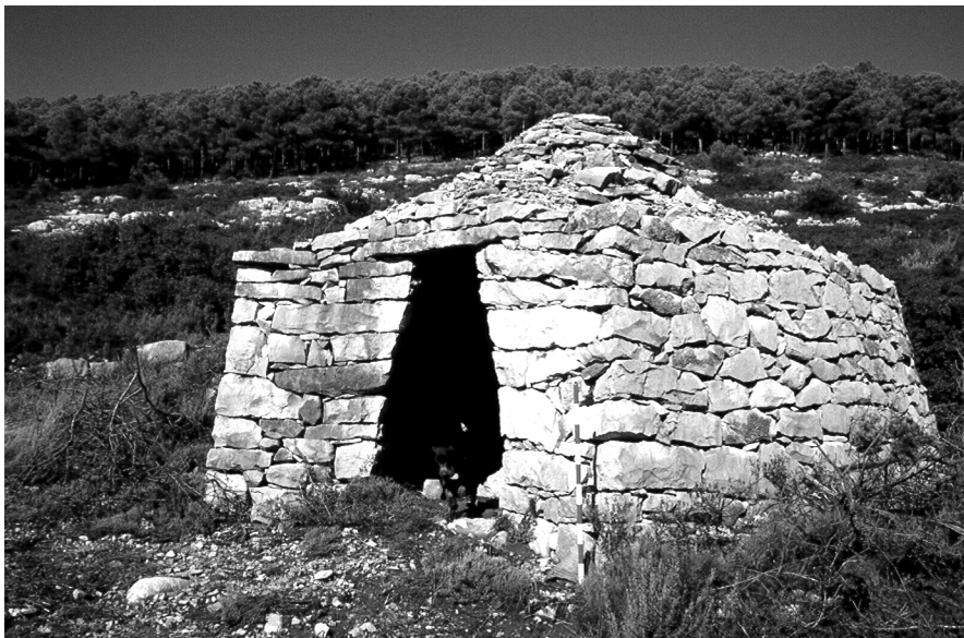
Figura 3: Barraca de pedra seca. Tirig (l'Alt Maestrat).