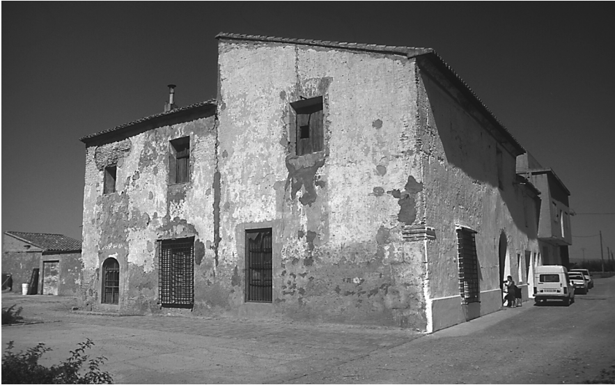
Figura 13: Alqueria Baixa. Horta de València.