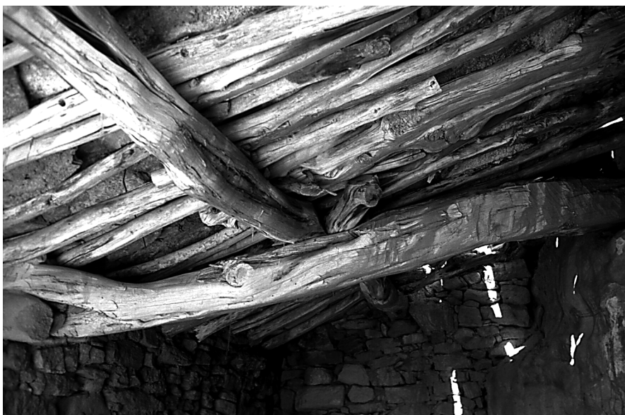
Figura 6: Coberta de troncs de sabina i lloses de pedra d'un refugi. Alpuente (Els Serrans).