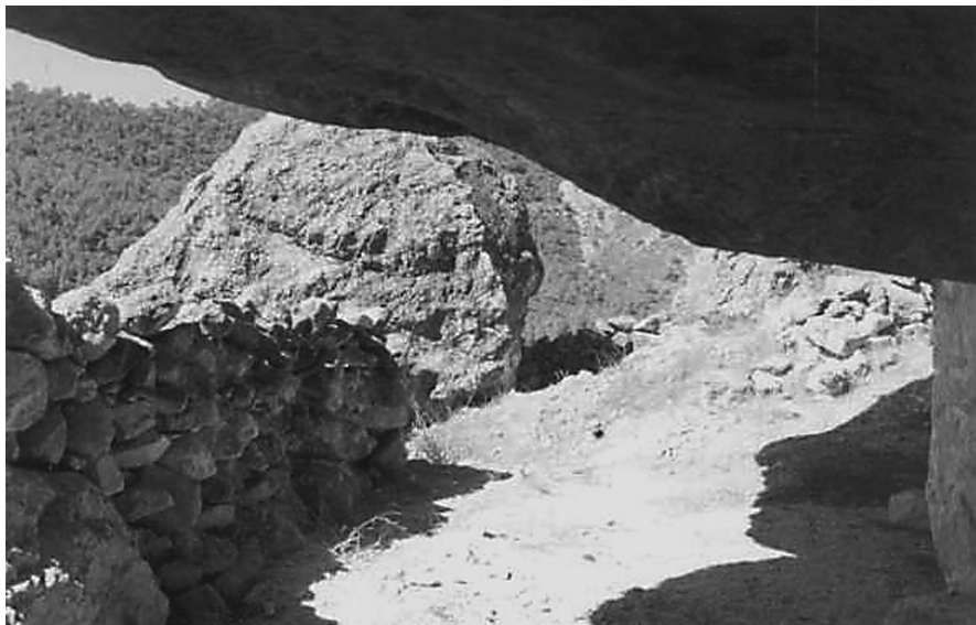
Figura 19: Corral de ramat construït sobre un abric a la Serra del Piojo. Oriola (Baix Segura). Foto: E. Diz. Inventari del Patrimoni Etnològic Immoble de la Comunitat Valenciana).