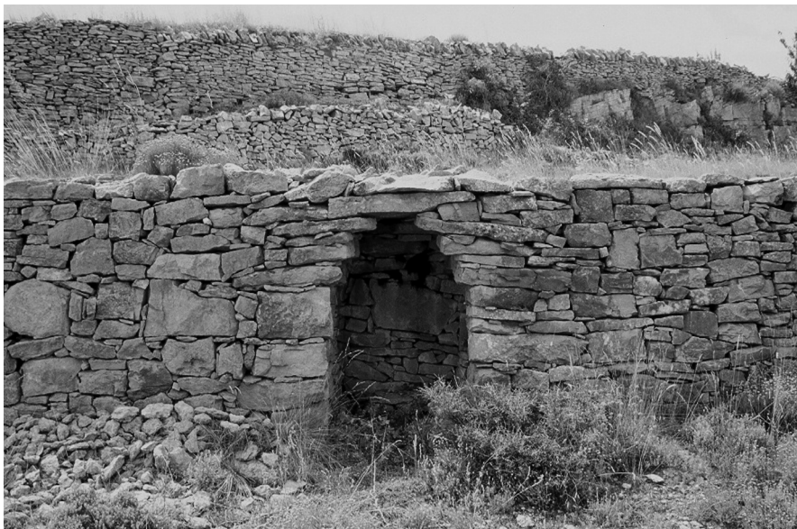
Figura 1: Marges de pedra seca amb un refugi integrat. Vilafranca (Els Ports).