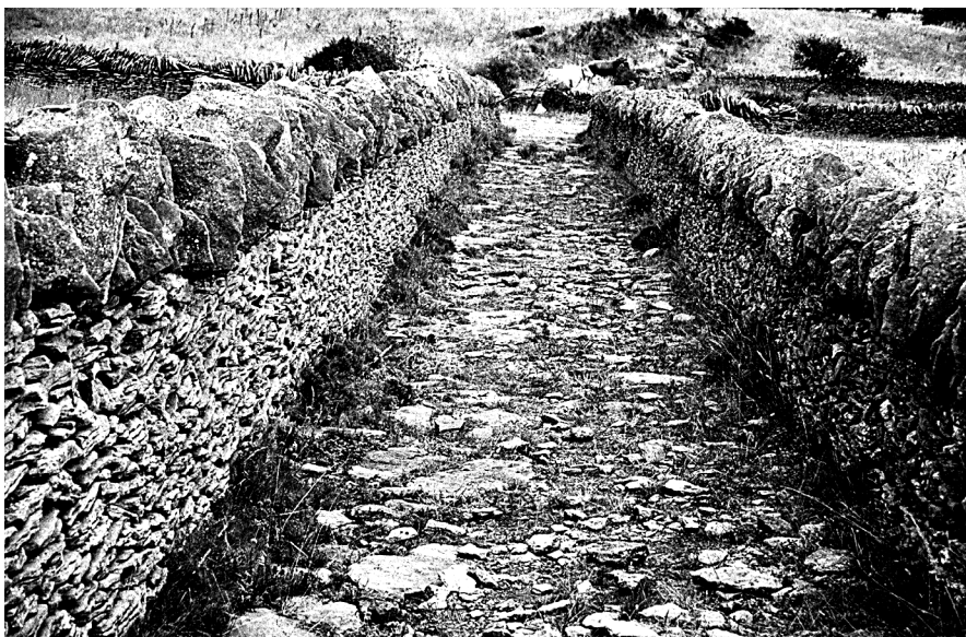
Figura 2: Assagadors tancats de paret amb coronament de rastrell per a evitar interferències amb el ramat. Vilafranca (Els Ports).