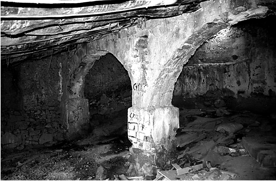
Figura 21: Corral de ramat amb tramades allindades amb arcs. Higuieruelas (Els Serrans).