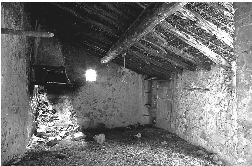
Figura 9: Espai d'ocupació humana en una casa d'una crugia. Titaguas (Els Serrans).