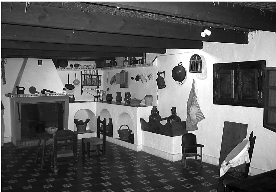
Figura 15: Recreació de la cuina d'una barraca. Museu de les barraques de Catarroja (L'Horta Sud).