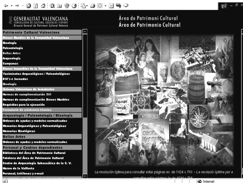
Figura 1: Pàgina Web, Sistema Valencià d'Inventaris. http://www.cult.gva.es/dgpa/ .