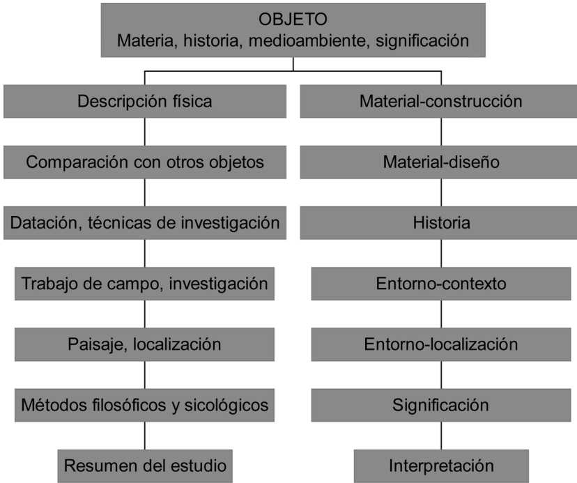
Figura 3: Qualitats de l'objecte (a partir de PEARCE, 1992).