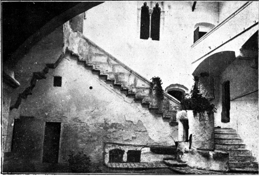
Pati central, entorn de 1920. (Lampérez, Arquitectura civil española , I).

Entre els historiadors valencians, ja Teodor Llorente (1889) 3 el deia edificat “a fines del siglo XV”, i Josep Martínez Aloy (c. 1925) 4 creu que hagué d’alçar-se entre el 1480 (any de l’adquisició del lloc d’Albalat per Tomàs Sorell) i el 1508 (mort del seu nebot i hereu, el cavaller Bernat Sorell). Dels tractats espanyols de la història de l’arquitectura, podem citar l’opinió de Vicente Lampérez (1922), 5 més o menys coincident amb els anteriors, perquè també atribueix l’obra del castell a Tomàs Sorell, mort segons ell el 1491 (la realitat és que va finir l’any 1485). El prestigiós arquitecte Fernando Chueca Goitia (1965), 6 que fa menció del palau amb elogi, com una peça característica del seu gènere, “con un patio del más puro estilo catalán”, no es pronuncia sobre la datació, i cal suposar que accepta la dels autors precedents. Arturo Zaragozá, finalment, reprén aquest criteri, car creu que és Bernat Sorell i Aguiló, senyor d’Albalat del 1485 al 1508, el seu constructor. 7