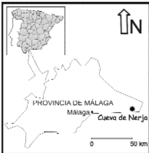
Fig. 1.—Situación geográfica de la Cueva de Nerja (Málaga, España).

La Cueva de Nerja está situada en la Ladera del Águila, en el flanco S de la Sierra Almirante, próxima al pueblo de Maro, dentro del término municipal de Nerja (provincia de