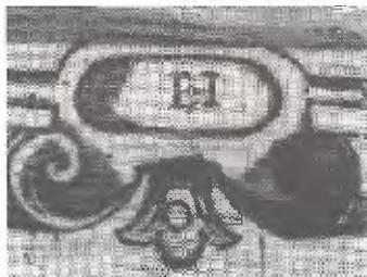
3. Detalle de la figura 2

go, que el tipógrafo praguense haya buscado para una tarea tan exigente de los círculos reales a un autor de fama internacional. Y Hornick, indudablemente, lo era. Adicionalmente, tal idea de distribución de los papeles en la producción del libro de Borja se corresponde perfectamente con el descubrimiento de Mirjam Bohatcová y Josef Hejnic, que el tipógrafo imprimió primero el marco, al cual incorporó posteriormente los grabados, cuyos clisés le fueron entregados ya hechos (11).