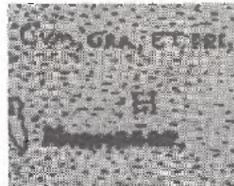
5. Detalle de la figura 4

Los presentes apuntes surgen gracias a los estudios realizados en la Biblioteca de la Universidad de Princeton, N. J., el cual me fue facilitado en la primavera del año 1991 por el estipendio de IREX (International Research and Exchange Board). La paternidad de los grabados del libro de Borja propuesta, aparece reflejada en el correspondiente número de catálogo de la publicación Verborgene Schätze der Nationalbibliothek in Prag , escrito conjuntamente con la doctora J. Kasparová.