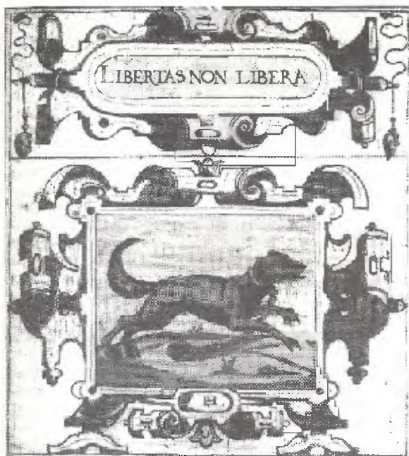
2. Emblema número 32 en las Empresas morales de Juan de Borja (Praga, 1581)