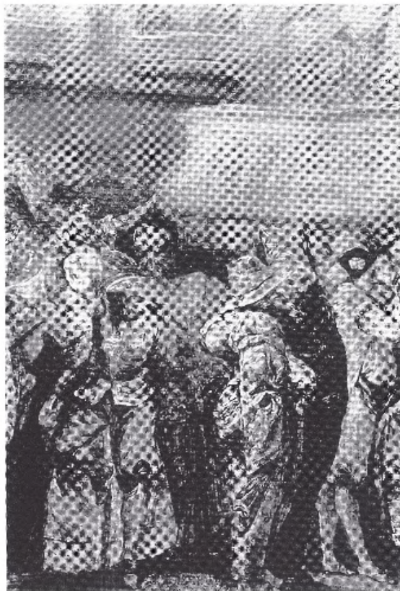
Fragmento de la Fiesta en el jardín botánico (Luis Paret. Museo Lázaro Galdiano. Madrid, 1790).

En otro orden de cosas, dado que en tiempos de Felipe V siguen de moda en la Corte española los bailes de máscaras, como bien reflejan los cuadros de Paret Baile de máscaras (Museo del Prado, 1767) y de Tiépolo Baile de máscaras (Museo del Louvre, París), imitando los carnavales de otras cortes extranjeras, produciendo “ innumerables ofensas a la Magestad Divina y gravísi-