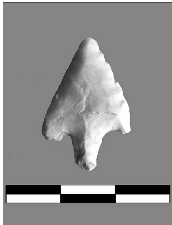
Làmina III. Punta de fletxa.

Una punta de fletxa de peduncle i aletes i cruciforme; a més a més, li falta un fragment de l'aleta esquerra; presenta un retoc pla, directe i profund. Aquesta s'ha realitzat sobre sílex lletós i té una pàtina de color blanc al voltant de tot el perímetre (lám. III).