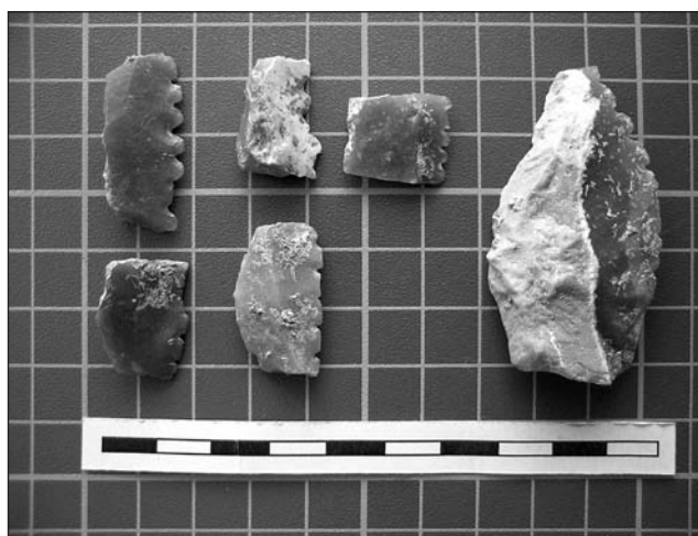
Làmina II. Elements de falç representatius de la col·lecció estudiada.

Pel que fa a les peces confeccionades sobre làmines-suports ( n = 6 ), dues són de sílex melat amb pàtina blanca i residu de còrtex —una d'elles té una dent fracturada. Les dues presenten un retoc simple, alternant i marginal a la zona denticulada i un retoc abrupte, directe i marginal a la zona de preparació per l'emmanegament. Les altres 4 dents de falç han estat elaborades amb sílex de diferents colors.