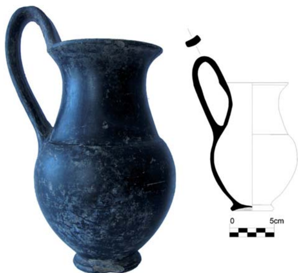
Fig. 1. Olpe de bucchero nero del Museu del Cau Ferrat (Sitges), n° d'inventari 1.247 (fotografia i dibuix).

(Ramon 2008: 43-44). Ens trobem davant del primer moment de freqüentació de la necròpolis urbana, amb evidències d'algunes incineracions als peus del puig.