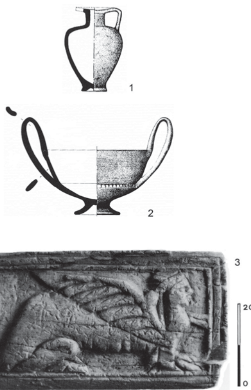
Fig. 2. Materials etruscos trobats al Puig des Molins. Elaboració pròpia a partir de Gómez Bellard 1991. 1. Aríbal piriforme. 2. Càntir de bucchero nero. 3. Placa d'os.

Amb aquesta gerra s'afegeix una peça més a l'inventari de bucchero nero a Eivissa. L'altra peça és un càntir, trobat al Puig des Molins durant la campanya d'excavacions al sector septentrional de la necròpolis als anys 80 (fig. 2: 2). Aquest va ser localitzat al sector de Can Partit (Via Romana 38) (Ramon 1994: 361), dintre de la fossa n° 5, la qual havia sigut reutilitzada: al seu interior havia incinerats una dona