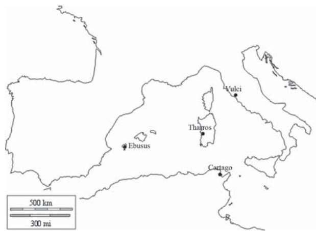
Fig. 3. Mapa de situació dels principals centres fenicis receptors i/o distribuïdors dels materials etruscos al s.VI a.E., incloent Ebusus.

De totes maneres nosaltres no veiem encara indicis clars per a pensar en aquesta ruta com a via principal d'arribada de materials etruscos, ja que hem detectat paral·lels tant a Sardenya (bàsicament Tharros) com a Cartago dels materials arqueològics que s'han recollit de cronologies arcaïques i de procedència etrusca. Per exemple, l'aríbal piriforme del Puig des Molins i que actualment es troba al MAC també té els seus paral·lels amb altres localitzats a Tharros i Cartago, a pesar de ser poc habituals al Mediterrani Central (Costa, Gómez Bellard 1987: 45). El càntir que es va trobar a les excavacions de Can Partit, en canvi, sol ser més freqüent als