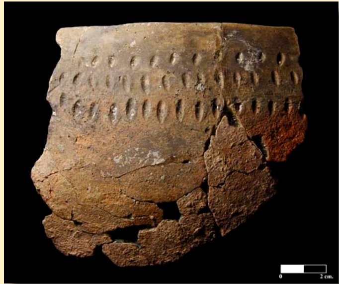
Figura 2. Recipiente nº 37 de Los Cascajos.

a) Presencia de inhumaciones en el área de habitación, dispuestas en posición flexionada dentro de fosas circulares. Se documentan en las estructuras 497, 183 y 196 de Los Cascajos (tab. 1) y Paternanbidea ( vid. supra ). Estas inhumaciones dentro de los poblados, que aparecen tanto aisladas como formando necrópolis, individuales, dobles o múltiples han sido recientemente publicadas (García Gazólaz, 2007; García y Sesma, 2007). Hay que destacar su importancia como elemento vertebrador del espacio habitacional y por ende social de la comunidad, reafirmando el cambio obrado en la territorialidad de estas primeras comunidades campesinas, con un nivel alto de sedentarización.