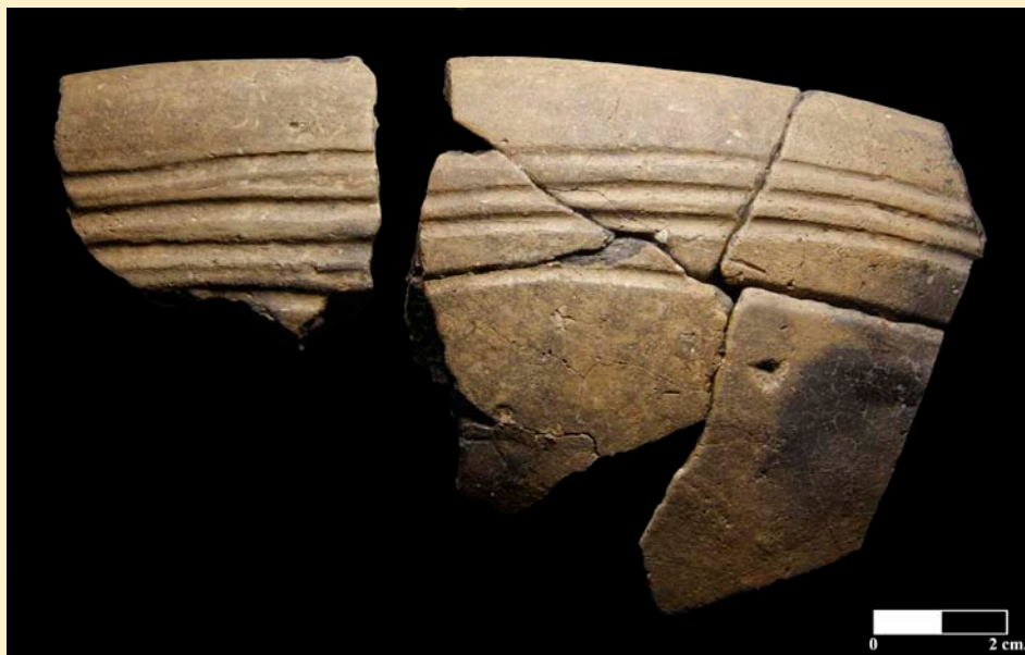
Figura 3. Recipiente nº 11 de Los Cascajos.

g) La presencia de la cerámica es constante en todas las estructuras neolíticas. Se presenta bajo la forma de recipientes cocidos de diversas morfologías, pero casi siempre, como más adelante se detalla, de perfiles simples. También se documentan grandes contenedores de gruesas paredes con una somera cocción. Ambos conviven en asociación en la sepultura 497, en la que un nivel con abundantes restos cerámicos de distintos tipos sella una sepultura en fosa.