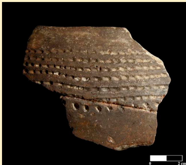
Figura 4. Recipiente n° 60 de Los Cascajos.