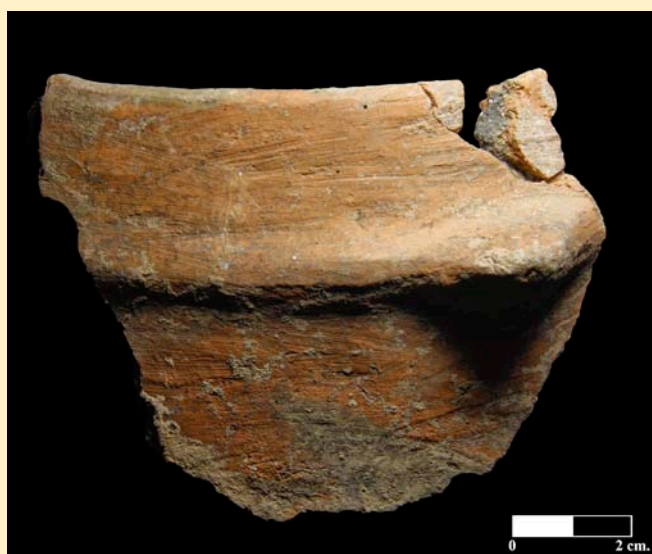
Figura 5. Recipiente n° 65 de Los Cascajos.