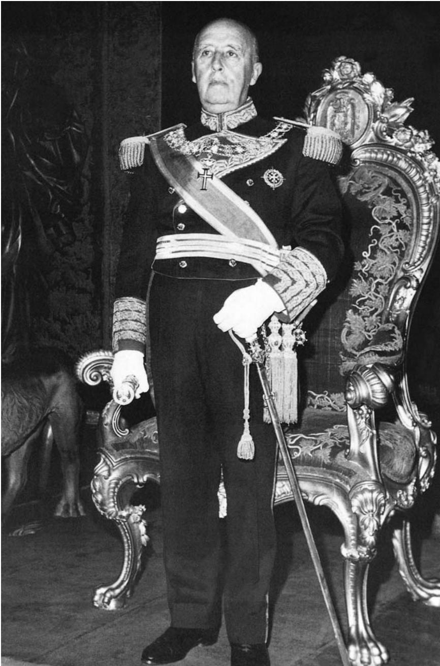
Franco "ennoblecido" con uniforme de gala

nietas de Franco con Alfonso de Borbón Dampierre, recogida en el NO-DO 1524 B (1972), cuyo tono frívolo y lujosa filmación en color se ponen al servicio de un star system ya muy asentado y en medio del cual el anciano general no parece más que un comparsa al que la cámara atiende escasamente. En los numerosos casos ante-