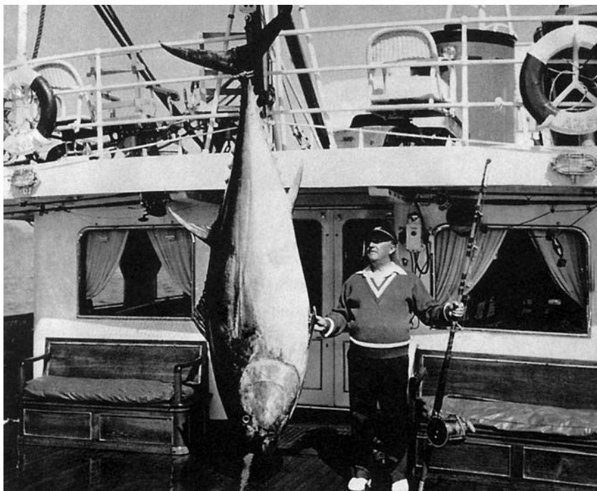
Franco posando con su presa