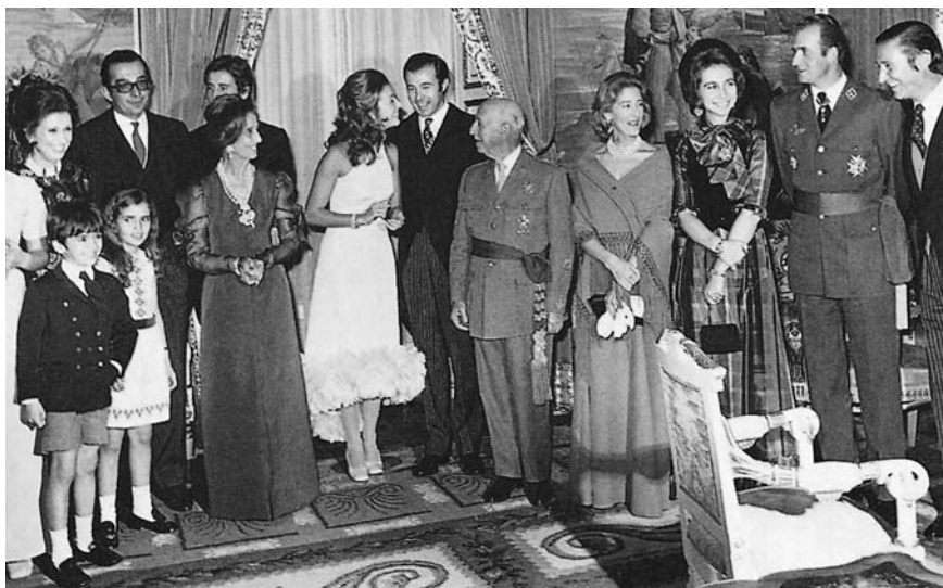
Foto del anuncio oficial del compromiso matrimonial entre Alfonso de Borbón Dampierre y María del Carmen Martínez-Bordiú Franco

riores a este último, el Jefe del Estado aparece en discreto traje de paisano y en su calidad de patriarca de una familia que es en sí noticia.