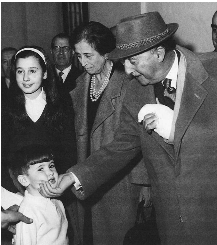
Franco acariciando a su nieto tras su accidente de caza de diciembre de 1961

Los términos familia y hogar se convierten en sinónimos de abuelo, en lugar de esposo o padre. En 1081 C (1963), el apartado "Información nacional" se inaugura con las vacaciones del Jefe del Estado en la playa, insistiendo en sus "horas de intimidad familiar". Nada ha variado. La tendencia a una retórica inmutable sigue siendo la norma de la casa, pero bien sabemos que las palabras adquieren en contextos ligeramente distintos acentos o incluso significados sustancialmente diferentes.