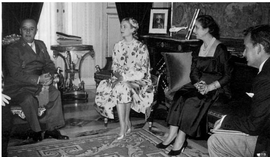
Franco con los príncipes de Mónaco

este desesperado esfuerzo por salvar la apariencia del Caudillo : excusatio non petita, accusatio manifesta .