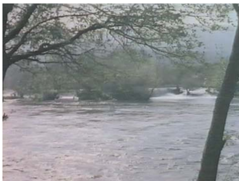
Serie fotográfica 3