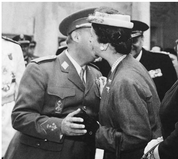
Franco y Carmen Polo

Si fuera cierto –y abrigo pocas dudas al respecto– que la ideología de Franco es más una rabiosa contraideología ante las sacudidas del espíritu revolucionario que una doctrina coherente de principios sólidamente constituidos, bien podría postularse que, en los estratos más profundos del imaginario franquista, el titánico esfuerzo de los aguerridos soldados no habría sido sino una virulenta reacción contra el extravío de esta ensoñación bucólica, a la que un anhelo invencible habría de hacernos retornar tras la victoria incondicional sobre el enemigo. No es casual que los escenarios de esta belleza rural incontaminada, esta suerte de edad de oro ajena al progreso técnico y a los conflictos humanos, fueran cultivados por los servicios de propaganda e información franquistas durante décadas, como tampoco sorprenderá que en su epicentro emerja la figura del mismo creador y artífice de estas bucólicas , Franco en persona.