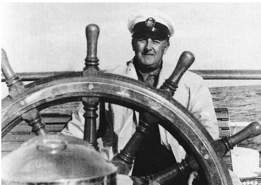
Franco en el Azor

6. JOSÉ MARÍA GARCÍA ESCUDERO, profundo conocedor del discurso cinematográfico del régimen, acostumbraba en conferencias, entrevistas y en el artículo que publicamos en este mismo volumen a fijar la conformación de la imagen humana de Franco en 1953.