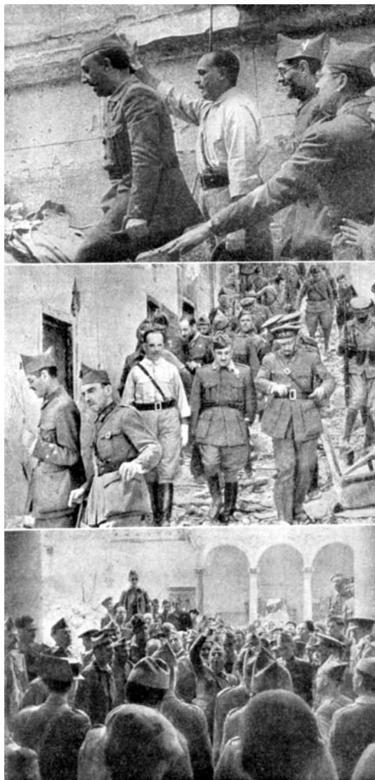
Franco en su primera visita al Alcázar tras el asedio

La visión de la ruina en el soporte del noticiario se revela así una verdadera exaltación, algo ciertamente obscuro, retornando como vívida imagen del pasado, incluso en un tiempo en que la herida infligida había cicatrizado y la reconstrucción de la fortaleza había sido concluida. Mas este elogio de la ruina va frecuentemente