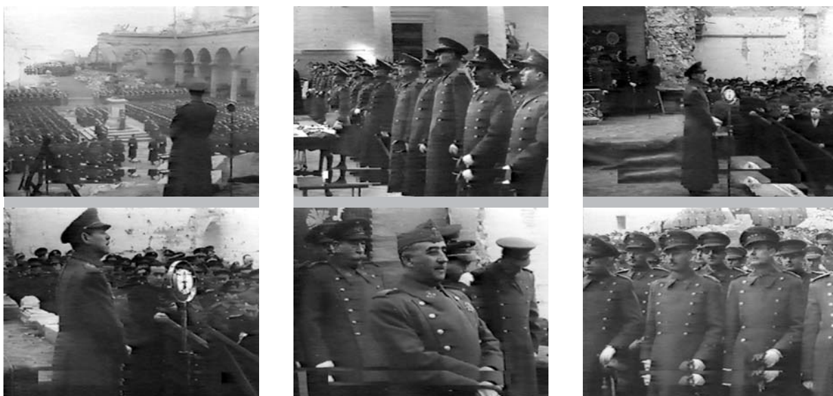
S.E. el Jefe del Estado —dice el locutor— llega a las gloriosas ruinas del Alcázar toledano. En el patio central forman los nuevos oficiales de Estado Mayor y alumnos de todas las academias militares. A la sombra de la cruz, ante el altar de los caídos, se celebra una misa. El Ministro del Ejército, general Asensio, dirige una vibrante alocución a los nuevos oficiales antes de serles entregados los despachos e impuestos los fajines 8 .

8. Reproduzco literalmente el contenido de algunas locuciones, aun a riesgo de resultar algo excesivo, debido a su valor documental y al interés que puede tener para otros investigadores cotejar estos textos con otros pertenecientes a la prensa, discursos, relatos, etc, tanto más cuanto que el estudio retórico me parece fundamental para establecer el modo en que se fija la memoria.