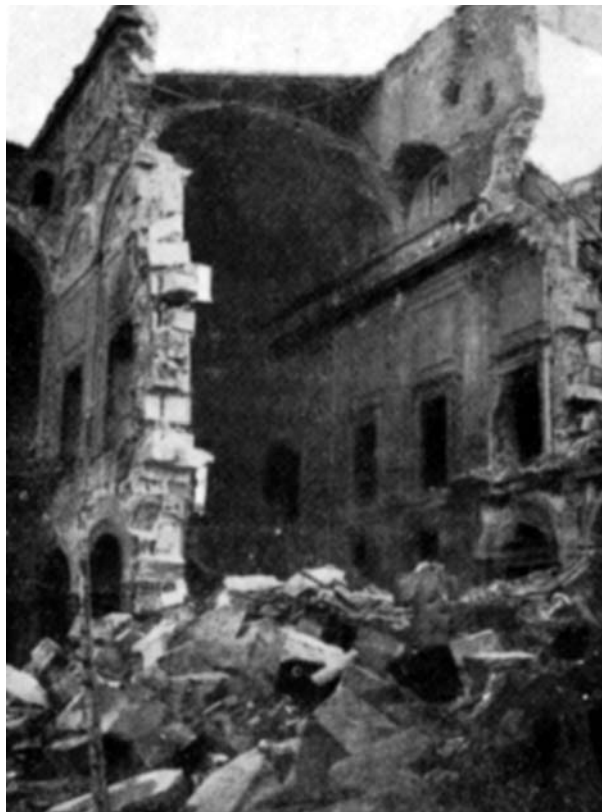
Ruinas del Alcázar

Como Delegado Nacional de Deportes, el general Moscardó supo entronizar y capitanear un sentido del esfuerzo atlético en nuestra nación. Los que sirven a España desde el puesto deportivo lloran la muerte de Moscardó muchos proyectos ilusionados y una hermosa valentía para hacer del atletismo una sana y lícita alegría del hombre español, porque el héroe supo seguir siéndolo en el frente olímpico de la Patria y esa es también una gloria y un último laurel de su resplandeciente corona.