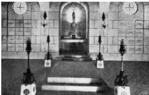
Cripta construida después del asedio

viembre de ese mismo año 1936 y ya Risco, en su temprana obra, da cuenta del empeño de sus compañeros por izar el mástil de la catolicidad entre los muros del Alcázar: "Sus compañeros —señala— están recogiendo los hechos edificantes de tan virtuosa vida, para introducir la causa de beatificación de este precioso retoño de la