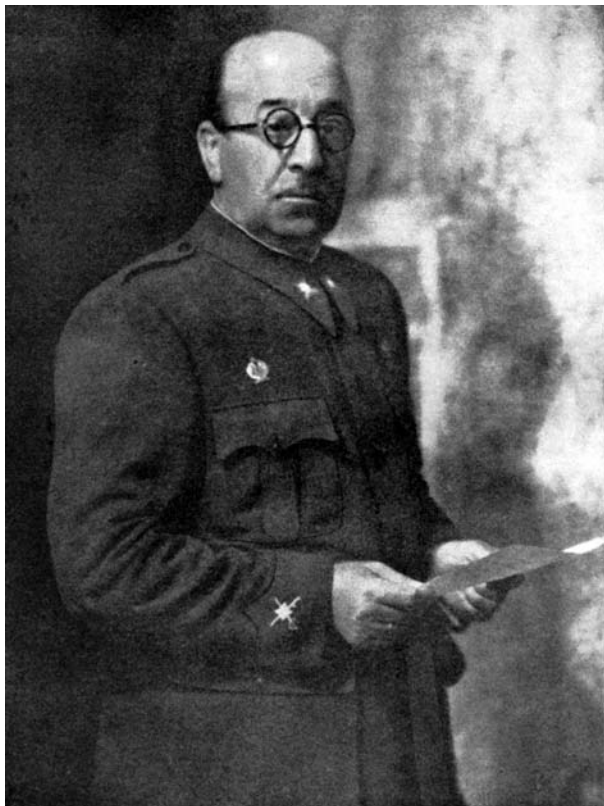
El general Moscardó

del Alcázar, nº 26, octubre de 1939) 11 , en donde se le impone la Cruz Laureada. Tan solo en dos ocasiones más, la figura de Moscardó trasciende los límites de su modestia. La primera de ellas tiene lugar en el nº 298 B de NO-DO, correspondiente a 1948, en el que se refiere la concesión al general por parte de la villa de Tarifa de la Medalla de Oro de la ciudad. Este hecho es altamente significativo por cuanto Tarifa fue la plaza legendaria defendida por Guzmán el Bueno. Mediante este acto ceremonial, se confirma y da sanción oficial al espejismo histórico, es decir, al acoplamiento, más allá de las constricciones espaciotemporales, de dos hombres que sacrificaron lo más querido —el propio hijo— ante valores superiores como el honor y el amor a la Patria. NO-DO es fiel, así, a la leyenda de Moscardó, que ve en él la encarnación moderna de Guzmán el Bueno.