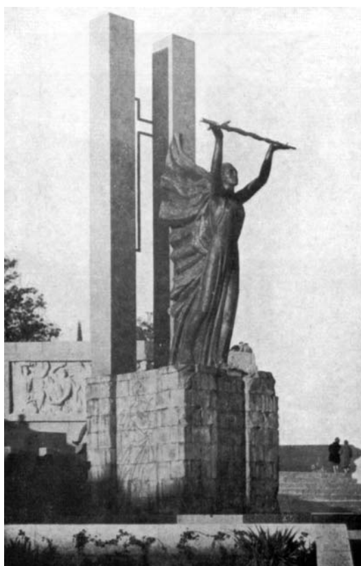
Monumento al Alcázar

Al filo de los sesenta, los viajes irán en aumento: Menderes, jefe de gobierno turco ( Menderes en España en nº 851 A, 1959), el presidente argentino Frondisi ( Argentina y España , 915 A, 1960), el ministro de Asuntos exteriores británico ( Información nacional , 961 A, 1961), el presidente portugués Américo Tomás ( Actualidad española , 987 B, y en noticia específica y más extensa En el Alcázar de Toledo , 987 C, 1961), Richard Nixon ( Actualidad española : 1068 A, 1963), el presidente tunecino Burguiba ( Noticias españolas : 1326 B, 1968), Haile Selassié, emperador de Etiopía ( Haile Selassie en Valencia y Toledo : 1479 B, 1971) 17 .