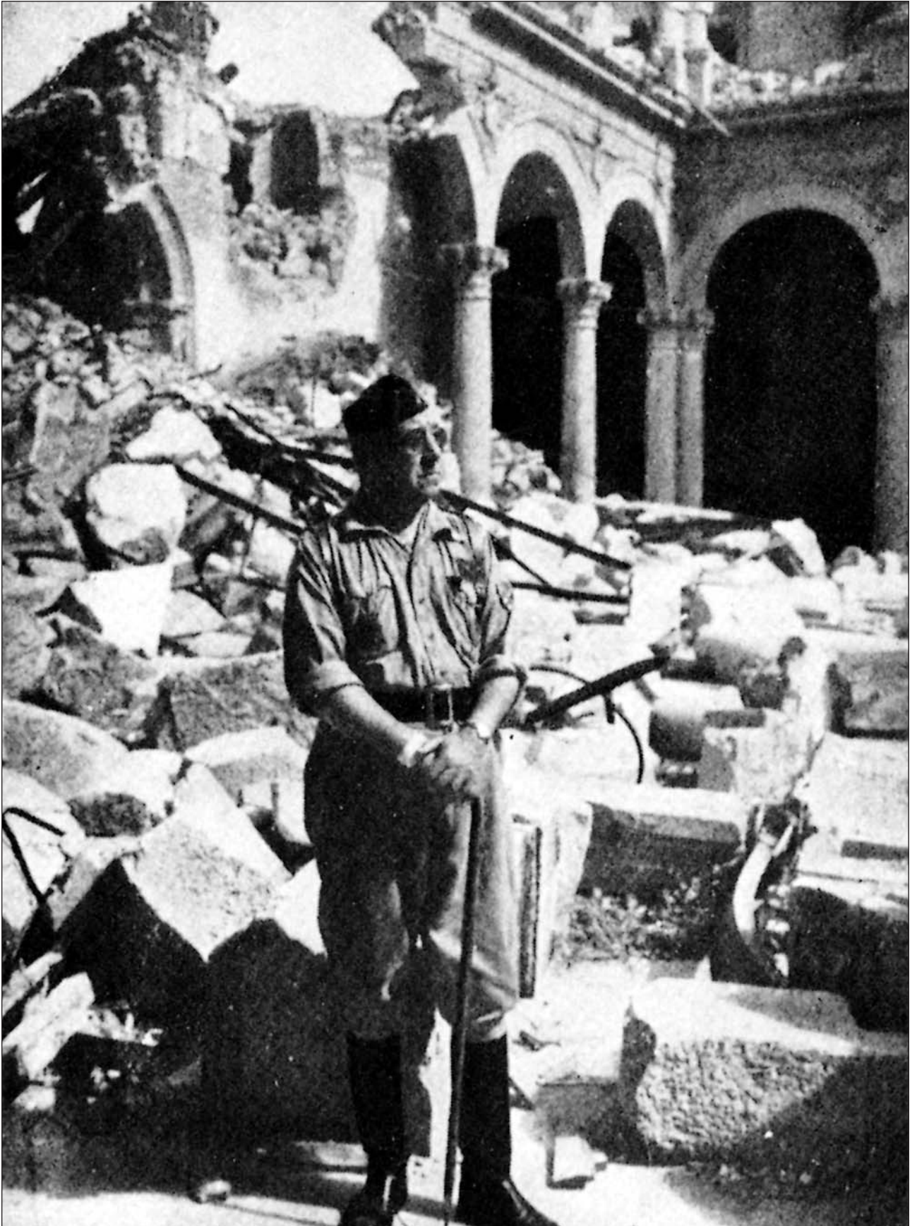
El general Moscardó en las ruinas del Alcázar