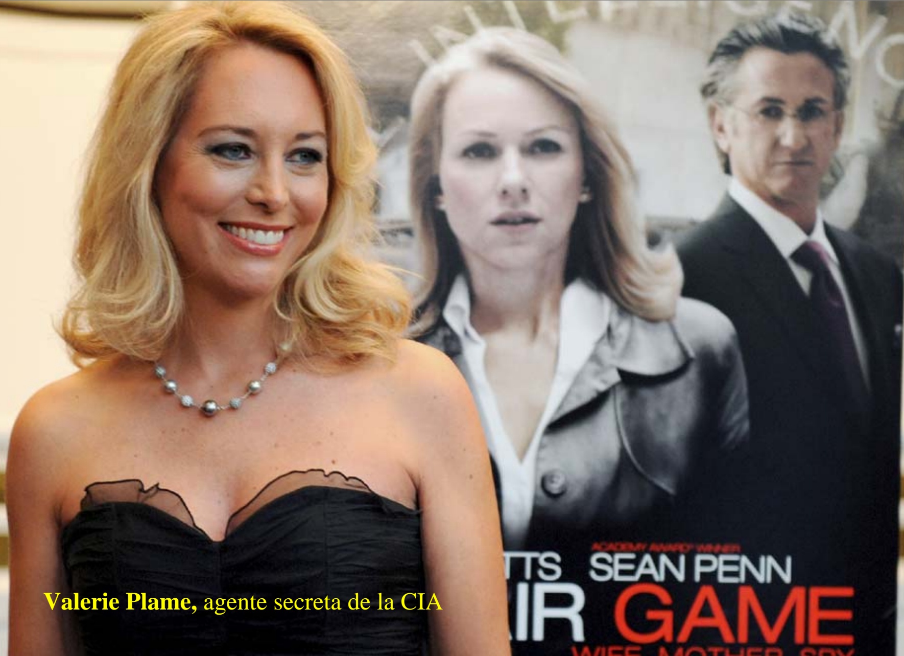
Valerie Plame , agente secreta de la CIA