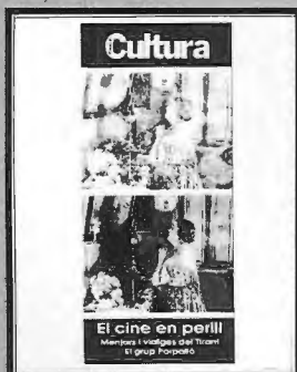
Portada: Fotograma de la pel·lícula Castigo de Dios.