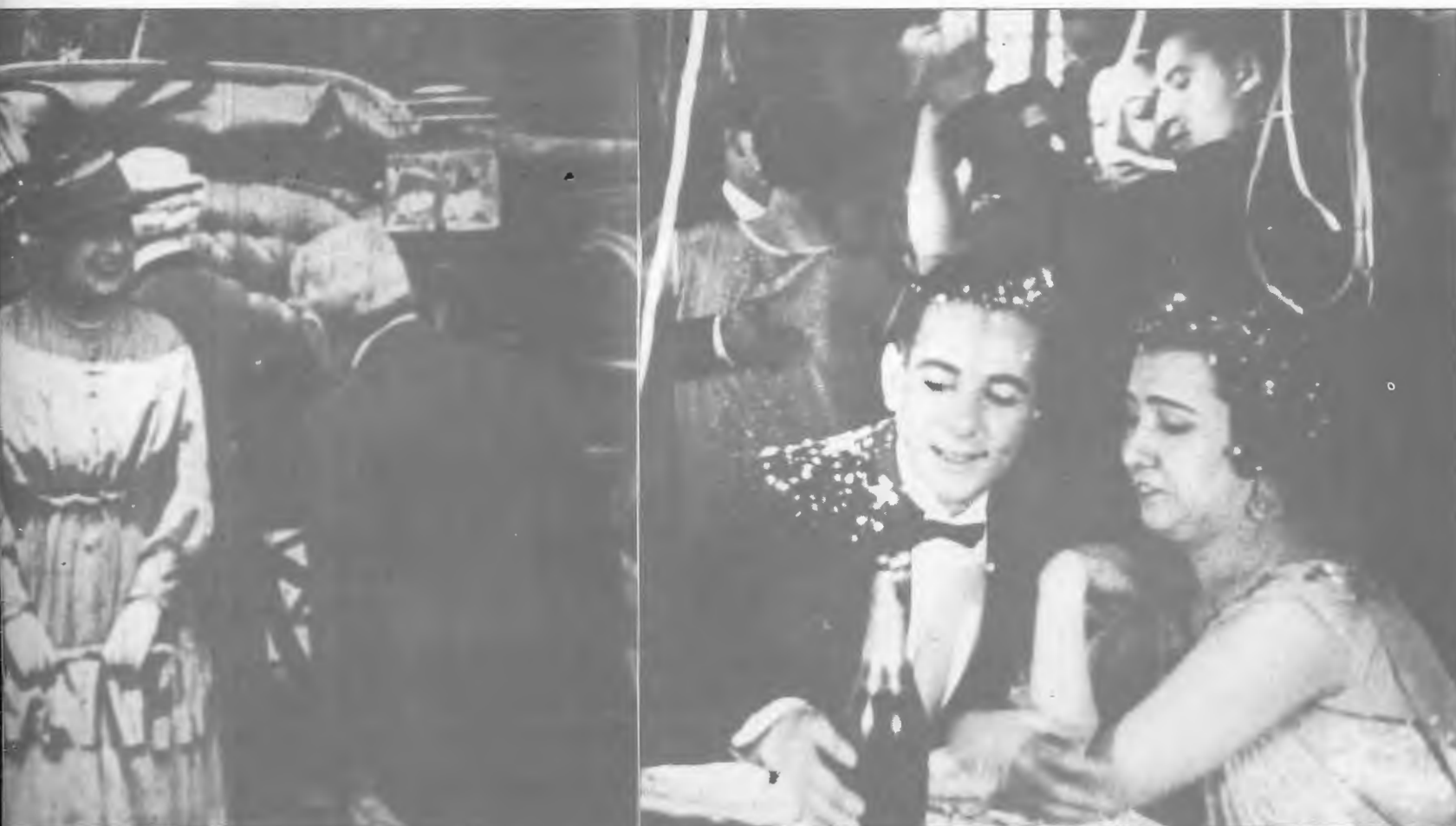
Ciente al archivo de la Filmoteca Valenciana