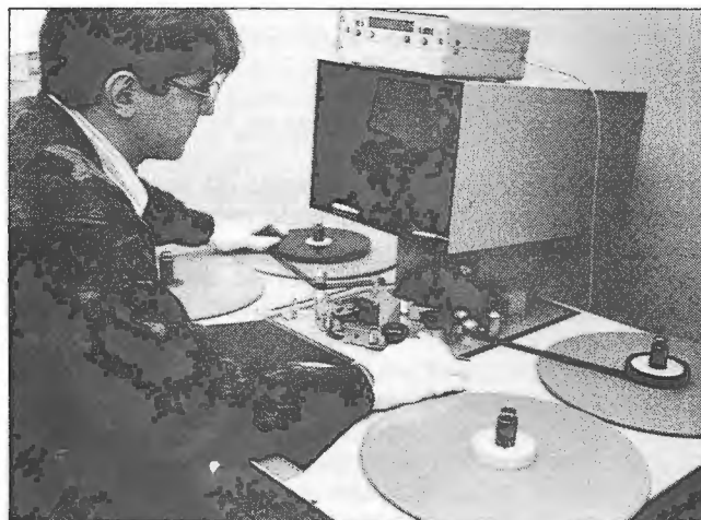
Proceso de revisión de material cinematográfico

Francamente, pocas son las esperanzas que albergamos en torno al éxito de la campaña en términos porcentuales o cuantitativos. Sin embargo, para algo que, aquejado de un aura tardía y herido de muerte como es el cine, se aleja para nosotros en el fondo de los tiempos vale, al menos, la pena intentarlo.