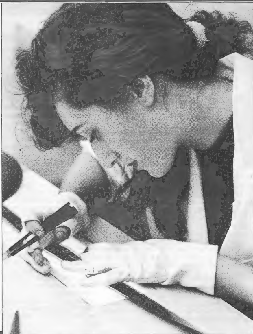
La minuciosa labor de restauración

A menudo se olvida que las imágenes que el cine robó al tiempo no gozan de la condición de eternidad. Su nacimiento en este siglo no ha impedido que el séptimo arte tenga tras de sí una larga lista de pérdidas definitivas, irrecuperables. Esto explica la razón de existir de las Filmotecas, su principal cometido: recuperar, restaurar y salvar para la posteridad las imágenes del pasado.