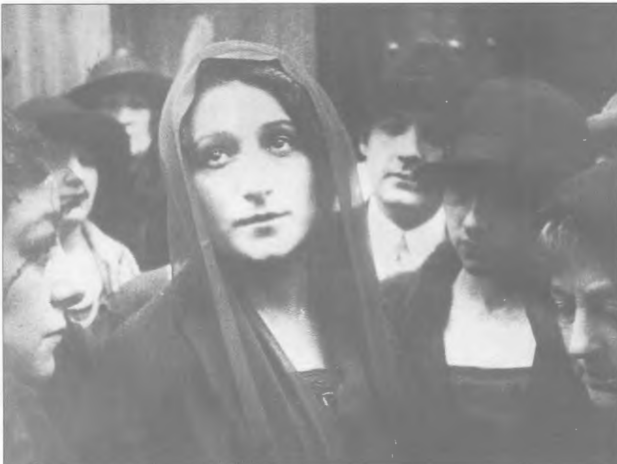
El cine contiene informaciones valiosas sobre su tiempo

aquello que será nuestro legado para la posteridad. Y al decir esto hemos de repetir: «independientemente de su valor concreto».