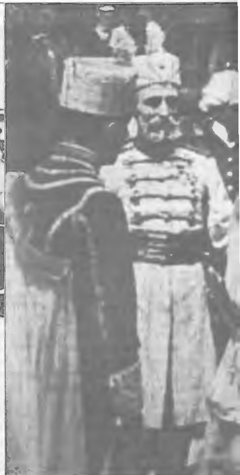
Castigo de Dios, (Hipólito Negre, 1925), todo un éxito de restauración y conservación