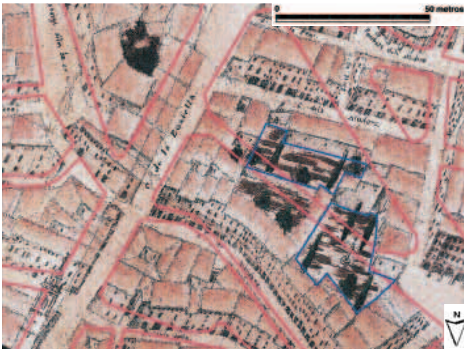
Figura 4. Superficie estimada de los cementerios parroquiales, mediante un proceso de corrección geométrica. Versión digital del plano de Tomàs V. Tosca, 1704 (Ajuntament de València, 2003), georeferenciado sobre un plano actual (vid. Nota 2). Cementerio de San Martín: 409 m 2 , Cementerio de Santa Catalina: 621 m 2 .

ción. Sí queremos comentar ahora, a la vista del plano de Tosca, la menor extensión que parece tener el cementerio de San Martín respecto al de Santa Catalina, percepción confirmada por las mediciones que dan como resultado 409 m 2 y 621 m 2 , respectivamente 2 . Para la estimación de la superficie de las parcelas de los camposantos se ha utilizado una versión digital del plano de Tosca (AJUNTAMENT DE VALÈNCIA, 2003) y se ha llevado a cabo un proceso de corrección geométrica, utilizando como puntos de control iglesias y edificios (San Martín, La Lonja, etcétera) dibujados por el oratoriano y que permanecen hoy día. Pese a que el plano de 1704 está realizado en perspectiva vertical y no en proyección ortogonal plana, resulta aceptable la correspondencia entre ambos documentos (fig. 4). Cuando un siglo más tarde, en aplicación de la Real Cédula de 3 de abril de 1787, ambos fossars sean suprimidos, el ayuntamiento tendrá ante sí unos terrenos cuya superficie y ubicación los hacen susceptibles de aprovechamiento para usos públicos, apertura de calles y plazas, o para reedificaciones.