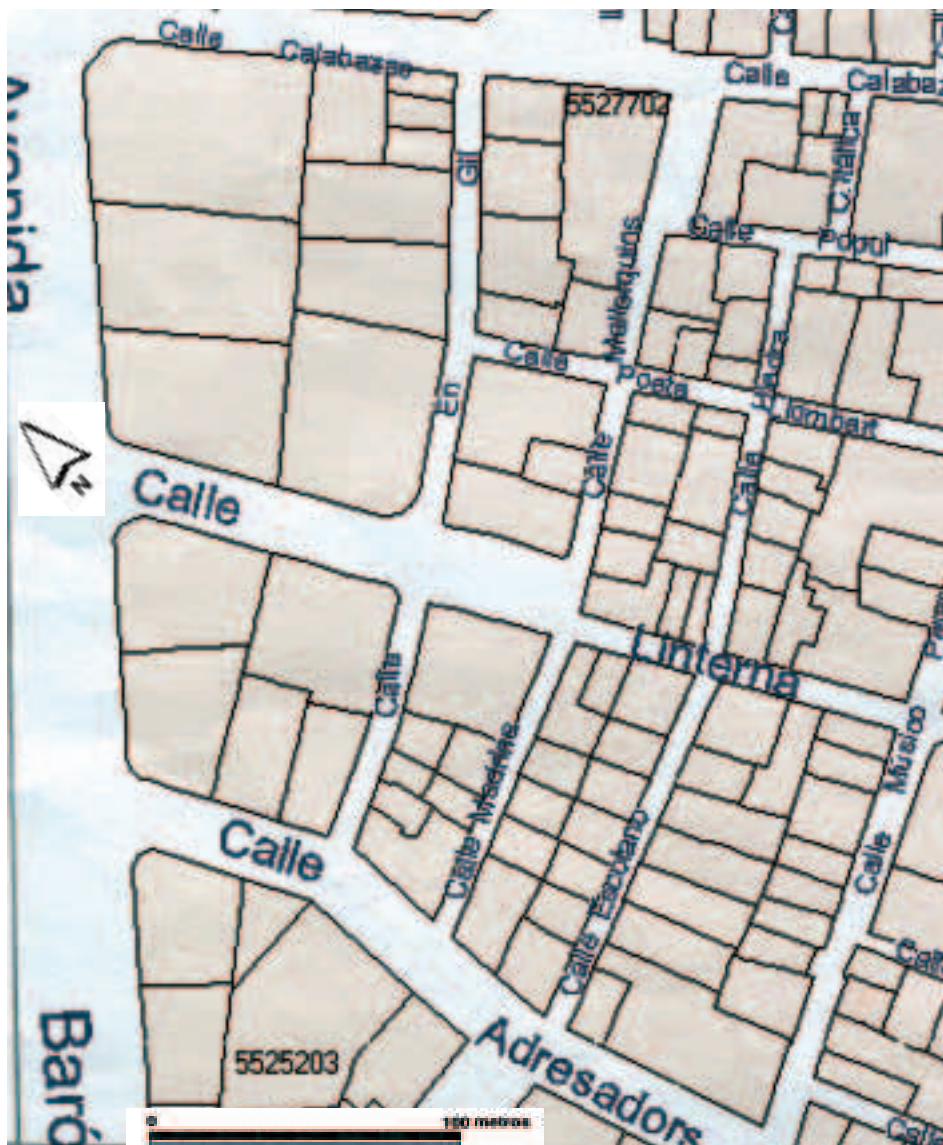
Figura 8B. Pervivencia en la estructura parcelaria actual de una trama regular que confiere, a este enclave concreto, menor atomización respecto a las manzanas colindantes. Valencia Urbanística, Ajuntament de València. AUMSA, 1998.

San Gil, en 1860) hasta la antigua confluencia del c. de Falcons y la Pl a . de Pertusa , hoy avenida del Oeste, vía urbana que, por otro lado, desmembraría en profundidad la estructura morfológica del enclave. (En este caso, el 'rango' de avenida está justificado, ¡no así para la de María Cristina!, aunque su apertura conllevarse igualmente la supresión de estrechas travesías: el c. de la Font , c. de Matalafers , c. de Flors , de les Roses en 1892). En efec-