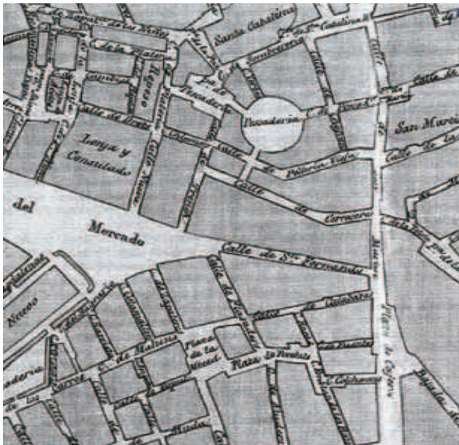
Figura 6. Plazas del paisaje urbano de la zona en el siglo XIX. Pescaderia (Plaza Redonda), del Mercado , de la Merced y de Porxets . (La de Cajeros, sólo un ensanchamiento de la calle de San Vicente, desapareció en las primeras décadas del siglo XX). Plano de Valencia (1869). Cuerpo de Ingenieros del Ejército. Escala 1: 2.500. (Detalle).