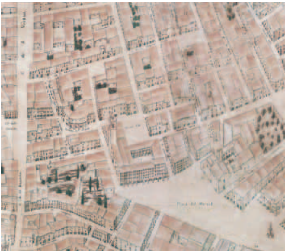
Figura 2. La zona urbana estudiada. A: Plano manuscrito de Valencia, delineado por Tomàs V. Tosca, 1704 (Fragmento).

(1993), determinó la relación continente-contenido en este enclave claramente menestral donde se ubicaban diversas instalaciones vinculadas a la venta de productos alimenticios así como a la prestación de servicios. Veamos algunas referencias. Muy próxima a la Plaça del Mercat estaba la de les Herbes , que albergará en el siglo XIX la nueva Pescadería, lugar que se corresponde hoy con la calle homónima y la Plaza Redonda y en el que Tosca rotuló Peixcateria , cuya fábrica mandó realizar la ciudad en 1668 (SAN PETRILLO, 1919). Tampoco era casual la localización de una de las fuentes urbanas, la de la Boatella (RODRIGO, 1922), en el cercano c. de Sant Vicent , que daba nombre al c. de la Font situado entre aquél y Porchets dels Aluders , del mismo modo que el hidrónimo c. del Pohuet (ROSSELLÓ, 2004: 249) nos remite a la acequia de Rovella descubierta que pasaba por este atzucac (AMV, Libro Capitular Ordin o . de la Il e Ciud d . de Valencia . Año 1816). Otras instalaciones, un hostel o fonda, una taberna y hasta un horno, explicitan el binomio lugar-función. En el primer caso, el c. de la Llanterna fue nombrado también del Hostel de la Llanterna por Carboneros (1873) y Llombart (1887) y carrer de (l'Hostal) de la Llanterna , (ROSSELLÓ, 2004, con ortografía moderna); en cuanto a la segunda, ubicada en el c. de la Taverna roïga , marcó la toponimia de la zona, al menos así lo señala Orellana (1923-1924,