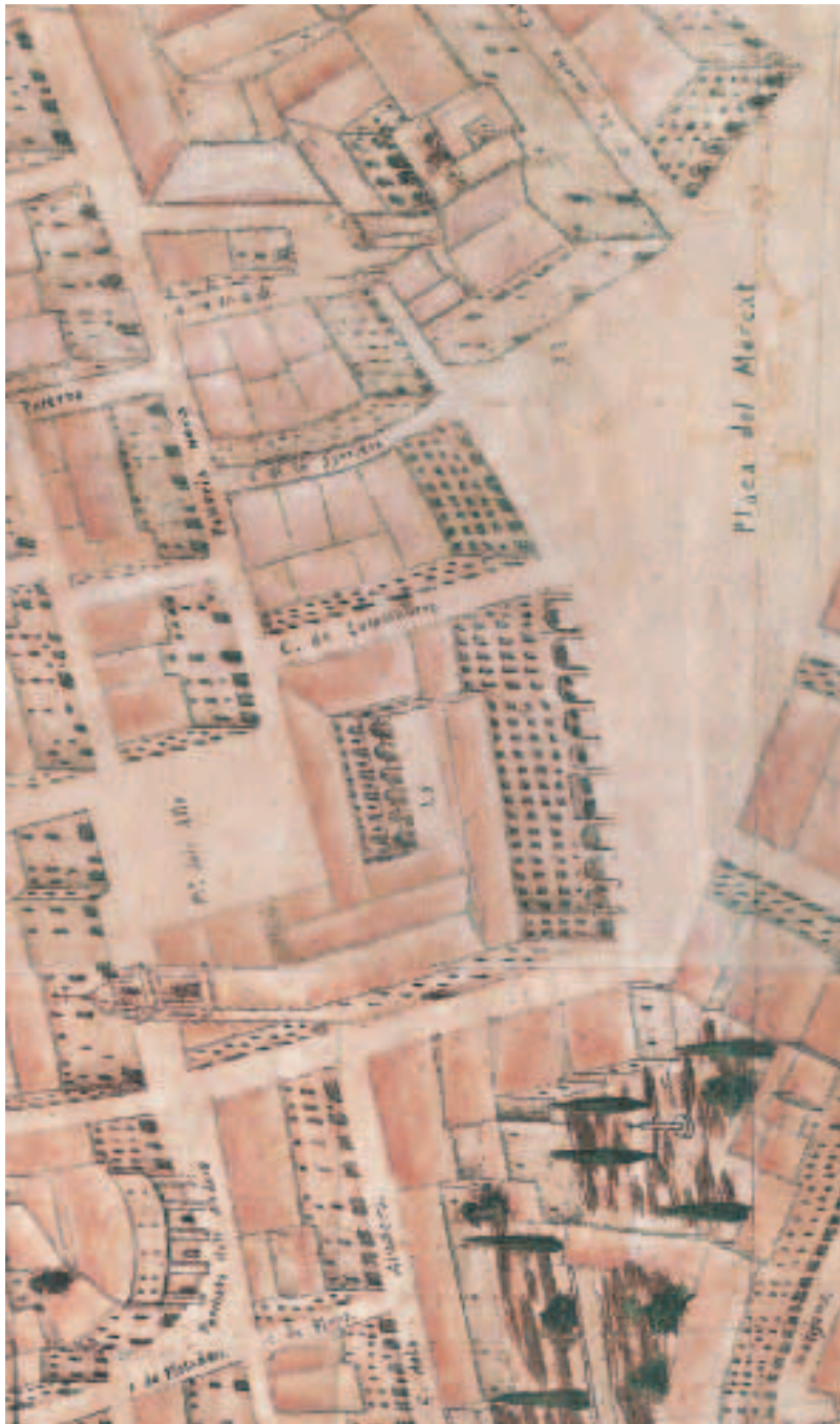
Figura 3. Convent de la Merce (25). Plano manuscrito de Valencia, delineado por Tomàs V. Tosca, 1704. (Detalle).