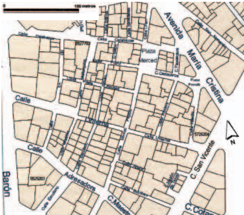
Figura 2. La zona urbana estudiada. B:Valencia Urbanística, Ajuntament de València. AUMSA, 1998.

II: 617), y lo repite Llombart, quien al referirse al antiguo nombre de la calle de Escolano menciona la existencia de una "... taberna con dos puertas [ pintadas en color rojo] que había en una de las cuatro esquinas (todavía llamadas Cuatro Cantons de la Taberna Rocha)... " (1887: 317). Dichas referencias explican que en el plano de Francisco Ferrer (1828) se denomine a la actual calle de Escolano, Taberna Rocha ( sic ), cuyo corto recorrido iba desde la plaza de Pellicers ( Pl a . de Pellicers ) a la calle de las Yervas ( Pl a . de les Herbes ). El eje c. de la Llanterna-Taverna roiga de Tosca se corresponde ahora con la calle de la Linterna (San Vicente-avenida del Oeste), mientras que la de Escolano ocupa un sector del c. de la Hedra que hoy, calle de la Hiedra, se extiende entre las de la Linterna y Pòpul. Ésta, que tanto Orellana (1923-1924) como Llombart (1887) citan del "Forn de la Mare de Déu del Pòpul", valida el tercer ejemplo.