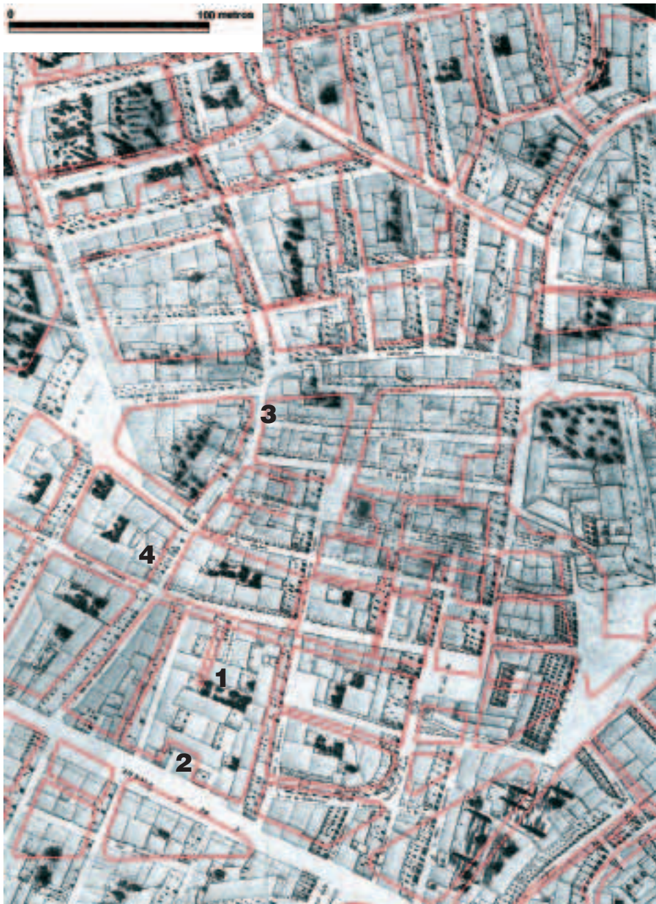
Figura 7. Plano actual del entorno urbano del desaparecido convento de La Merced, georeferenciado sobre el Plano manuscrito de Valencia, delineado por Tomàs V. Tosca, 1704. (Cartografía histórica de la ciudad de Valencia, 2004).