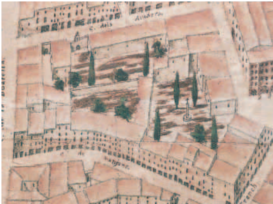
Figura 1. Cementerios urbanos de la Igl a Parroq. de S. Marti (al que se accedía por el c. dels Aluders ) y de la Igl a Parroq. de S. Catalina Martir (con entrada por la Plaça del Mercat ). Plano manuscrito de Valencia, delinado por Tomàs V. Tosca, 1704 (Detalle).

trazado del antiguo c. de les Repenedides , calle del Torno de San Gregorio en 1831. Dicha institución de acogida se funda en el siglo XIV, próxima a la Torre Cremada , exenta, que se hallaba en el camí de San Vicent (TORRÓ I GUINOT, 2001-2002: 55), y el convento anexo de monjas agustinas a inicios del siglo XVII ( conv. de S. Gregori, e casa de les Repenedides ). Por la calle Adressadors, Adreçador de Pellicers (ROSSELLÓ, 2004: 243), circulaba la acequia de Rovella, destacado componente de la topografía de este sector (TEIXIDOR I DOMINGO, 1989) que a través de sus brazos abastecía de agua a los talleres artesanales de la zona, caso de la adobería situada en la calle homónima (Tosca, 1704), entre las de la Llanterna y de Matalafers , como también a los huertos de los conventos de La Merced y las Magdalenas (SANCHIS, 2002) (fig. 2).