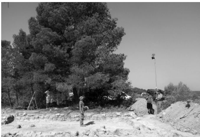
El pas del temps en la forma de dibuixar planimetries: A dalt, 2001, Kelin/ Los Villares (Caudete de las Fuentes, València) (Foto feta amb la primera càmera digital del Departament de Prehistòria i Arqueologia de la Universitat de València); A baix, 2007, Prenent dades per fer una ortofoto de El Zoquete (Requena, València). Empresa Global Alacant S. L. (Foto feta amb càmera digital r flex).