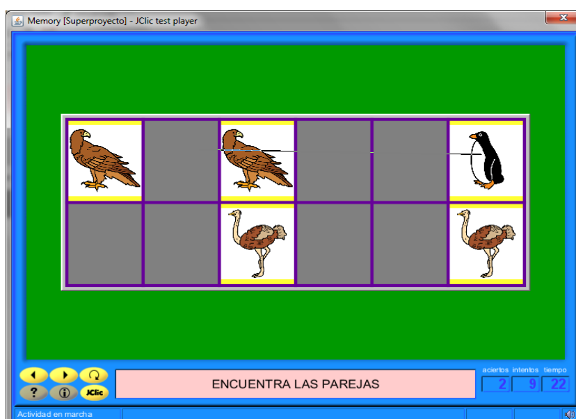
Gráfico n. 4. Juego de memoria elaborado por los estudiantes con Jclíc

El producto final de los estudiantes son actividades sencillas como puzzles, juegos de memoria, actividades de asociación, sopas de letras, etc. en que se trabajan aspectos básicos del currículum como la iniciación a la lectoescritura, el cálculo, o el trabajo de procesos psicológicos básicos como la memoria, o la percepción visoespacial. Un ejemplo de una de estas actividades (juego de memoria), puede verse en el gráfico 4.