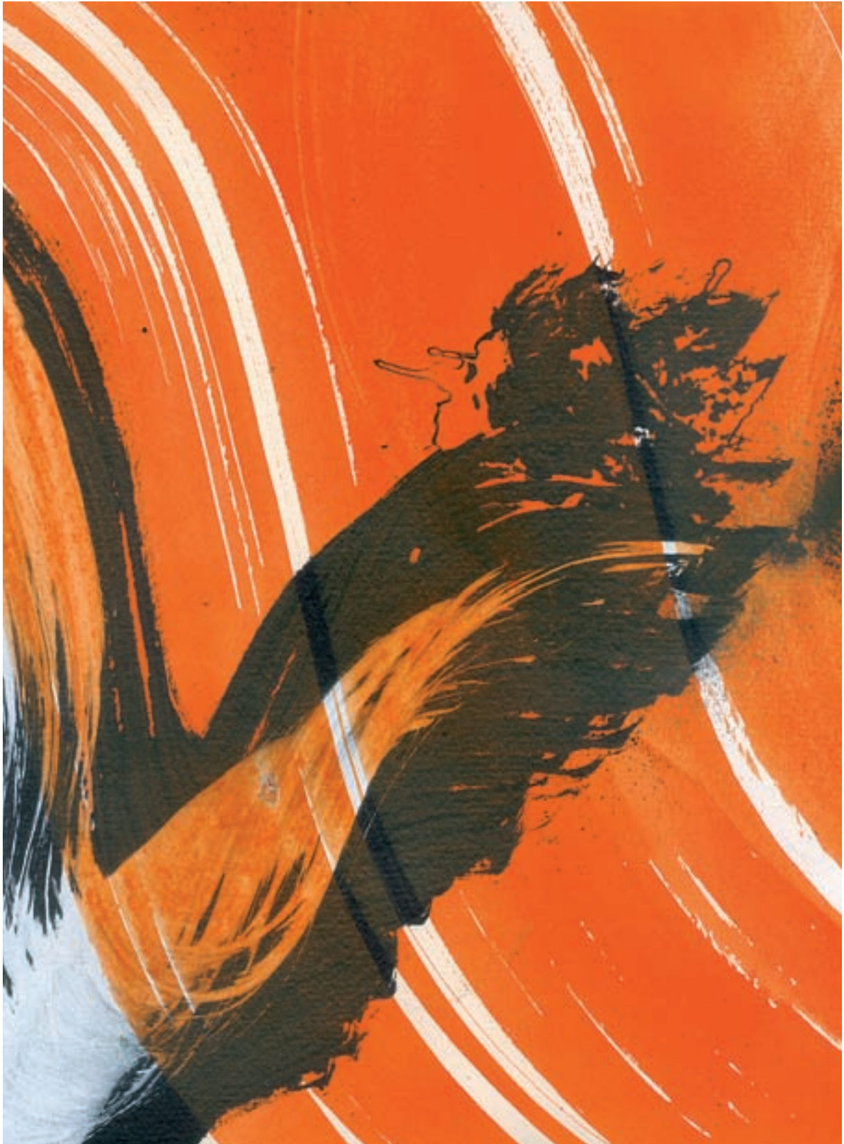
Juan Olivares. Viatge al centre de la Terra VIII , 2013. Acrílic sobre paper, 21,5x28,5 cm.