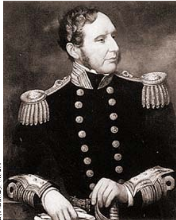
Royal Naval College, Greenwich

Darwin, jove i inexpert, volia aprendre, no pretenia establir cap teoria unificadora de la natura. Coneixia la teoria de Lamarck i les idees evolucionistes del seu avi Erasmus, però la seva posició era molt més propera a la de la conservadora teologia natural de William Paley. Aquells cinc anys, però, el convertiren en un naturalista capaç de plantejar nous models per explicar la gran complexitat de la vida. Algunes lectures el van influir profundament: el relat del viatge de Humboldt li obrí la imaginació i li mostrà una nova metodologia; la Introducció a l'estudi de la filosofia natural de John