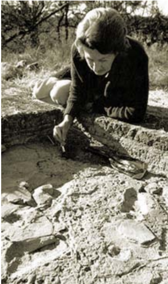
The Leakey Foundation

Mary i Louis Leakey, inspeccionant el fòssil d' Australopithecus boisei trobat per Mary a Tanzània. La troballa els va decidir a establir allí mateix un campament base permanent i dos anys més tard Mary hi va identificar les primeres restes d' Homo habilis .