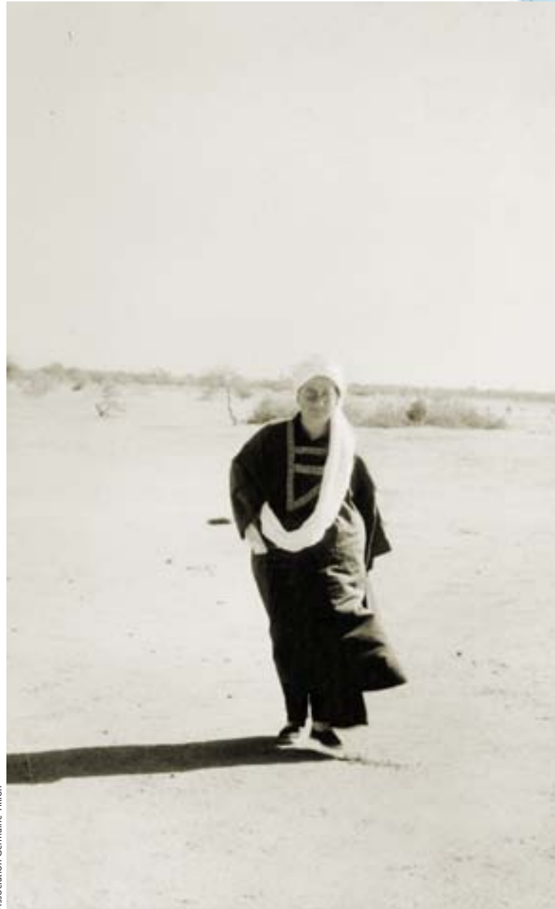
Association Germaine Tillion

Malgrat les adversitats familiars, va seguir estudis d'art antic i prehistòric a l'École du Louvre; de folklore, prehistòria i religions dels pobles primitius a l'École Pratique des Hautes Études; de sociologia a la facultat de lletres de la Sorbona; de llengua amaziga a l'École des Langues Orientales i d'etnologia al Collège de France (amb Marcel Mauss). Després d'una estada a Alemanya, Txecoslovàquia i Dinamarca, el seu mestre Marcel Mauss li va aconseguir una beca per a una campanya de recerca a la regió muntanyosa de l'Aurès, a l'est d'Algèria, un territori de població amaziga, on, al llarg de tres anys (entre 1935 i 1937) va haver de viure pràcticament sola estudiant la cultura dels berbers xaüia, compartint els seus desplaçaments transhumants.