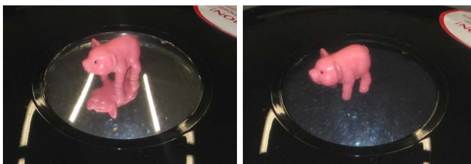
Figura 3: Detalle de la imagen producida por una primera reflexión adicional en el espejo E_2 y cómo la imagen reflejada se suprime al apoyar el objeto sobre un fondo absorbente.

Nota: El objeto puede apoyarse directamente sobre la superficie del espejo inferior. Sin embargo, si se coloca sobre un pequeño trozo de cartulina o tela negra, como el proporcionado en el kit experimental, el impacto visual de la imagen es mayor ya que se suprime la imagen producida por una primera reflexión adicional en el espejo inferior (imagen invertida en la Figura 3) así como las imágenes múltiples de otros objetos exteriores.