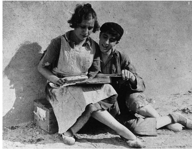
Figs. 1 y 2

decorados muy sencillos, casi artesanales (Fig. 1). De estos dos ámbitos topológicos, el relato prima lo exterior —constituido esencialmente por el patio común de vecindad, el corredor al que se abren las viviendas y las calles adyacentes—, allí se da cabida al personaje coral que arropa a los dos protagonistas. En sus constantes idas y venidas y dimes y diretes el grupo acaba conformando un fresco abigarrado con gran peso específico en la trama.