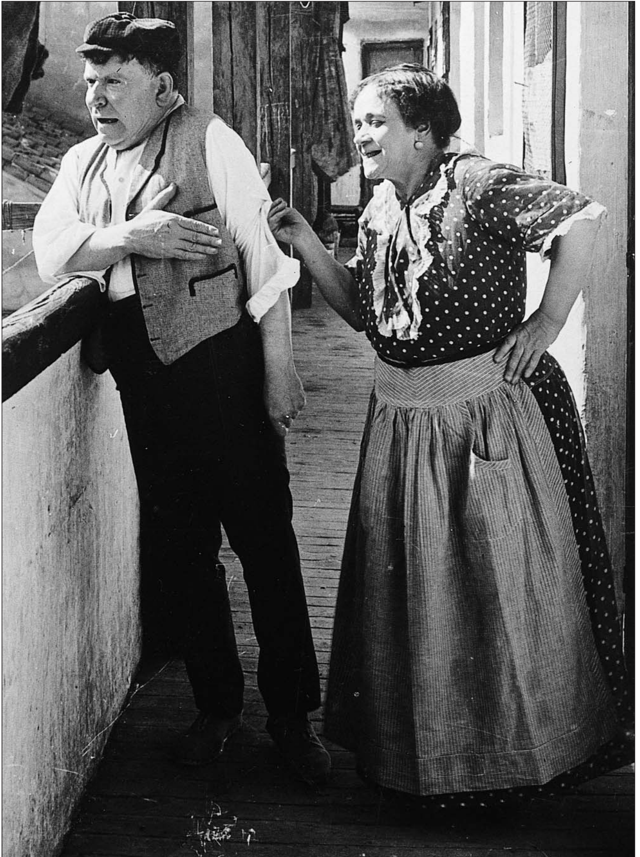
La Revoltosa (Florián Rey, 1924). Restauración hecha por Filmoteca Española