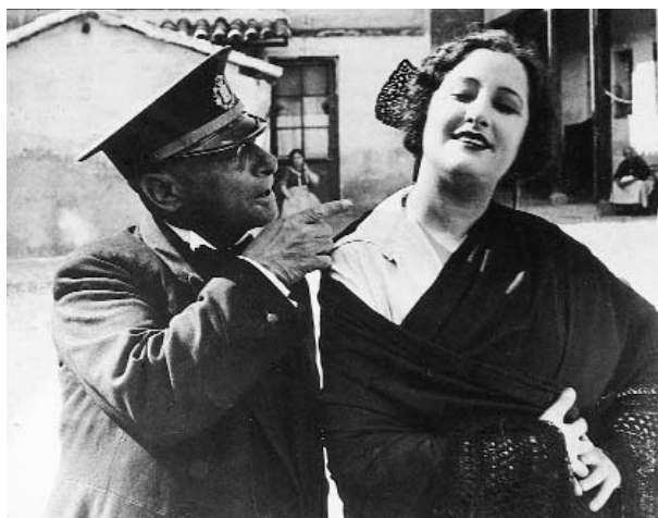
Figs. 3 y 4

contra su marido, se transforma en instrumento con el que la enunciación suscitará la carcajada fácil del público. Esta última función predomina sobre las restantes, pues, emergiendo por los resquicios que deja la peripecia central, el humor se cuela en el relato de la mano de los objetos, propiciando situaciones hilarantes que evidencian su vínculo con el sainete de origen.