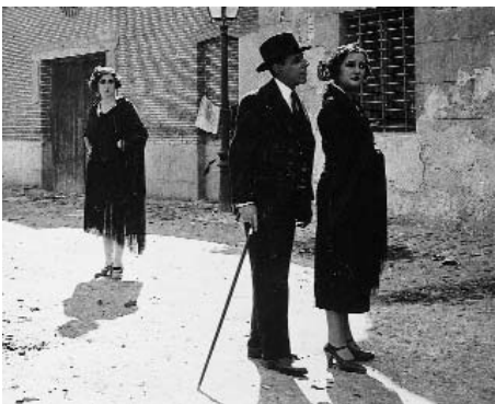
Figs. 5, 6 y 7

9. Al respecto, conviene recordar que el cine español no contaba, a esas alturas, con técnicos y auxiliares de maquillaje y cada actor realizaba esa tarea por su cuenta. Por lo que a la sobreactuación se refiere, el rosario de esporádicas escenas cómi-