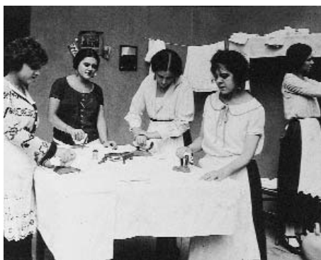
Figs. 8, 9 y 10

cas que jalona la película, desde su ingenuidad, están llamadas a estimular la complicidad del público sencillo con el que la enunciación quiere congraciarse, pero por cada una de esas aperturas hacia el humor asoman las huellas de un primitivismo narrati-