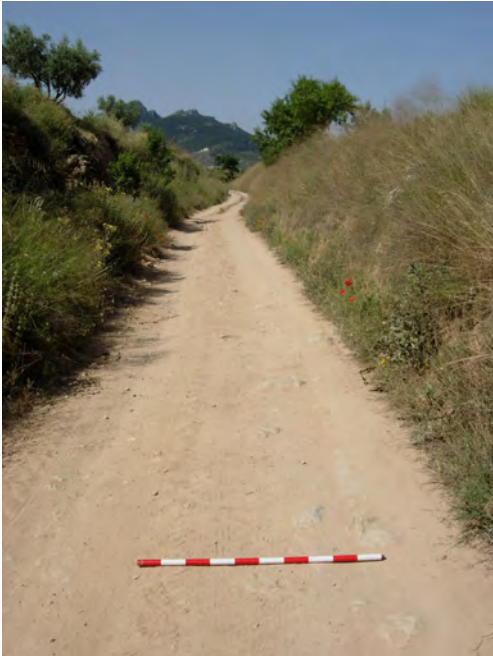
Figura 1. Vista del Camí Fondo al terme municipal de la Font de la Figuera.

tren, l'any 2004 es van obrir tres sondeigs amb motiu de la construcció del transvasament Xúquer-Vinalopó (Arasa i Pérez Jordà, 2005: 199-201). Segons es va poder veure, el camí s'havia reformat en època recent i s'assentava sobre una terrassa excavada en la roca natural de més de 6 m d'amplària. Aquesta preparació no pot datar-se amb seguretat, de manera que els resultats no van resultar conclouents sobre la seua atribució a una via romana. Aquest camí segueix en direcció SW, passa entre la Casa Real i la Casa de l'Àngel fins al Caicó, i vorejant els estreps del Capurutxo gira cap l'oest i SW. Diferents autors atribueixen aquest traçat a la via que travessava Castella-Manxa per Libisosa (Lezuza, Albacete) en direcció al Guadalquivir, que les fonts modernes denominen el Camí d'Aníbal.