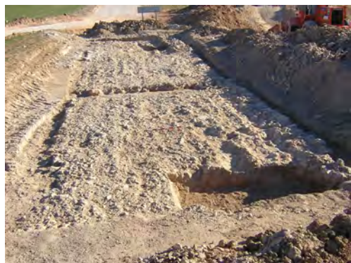
Figura 3. Vista de l'excavació feta al Camí de Villena l'any 2004.

diverses províncies de l'Imperi. A Hispània n'hi ha un altre a la via per Lusitaniam ab Emerita Caesaraugusta que per terres de Ciudad Real anava a Oretum (Roldán, 1975: 275). A Itàlia n'esmenta tres més on el topònim figura sol: un a Etrúria, a la Via Aurelia ; un altre al Laci, a la Via Labicana ; i el tercer a Calàbria, a la Via Annia Popilia fins a Columnam . N'hi ha un altre a Dalmàcia, a la via Aquileia-Siscia . En altres