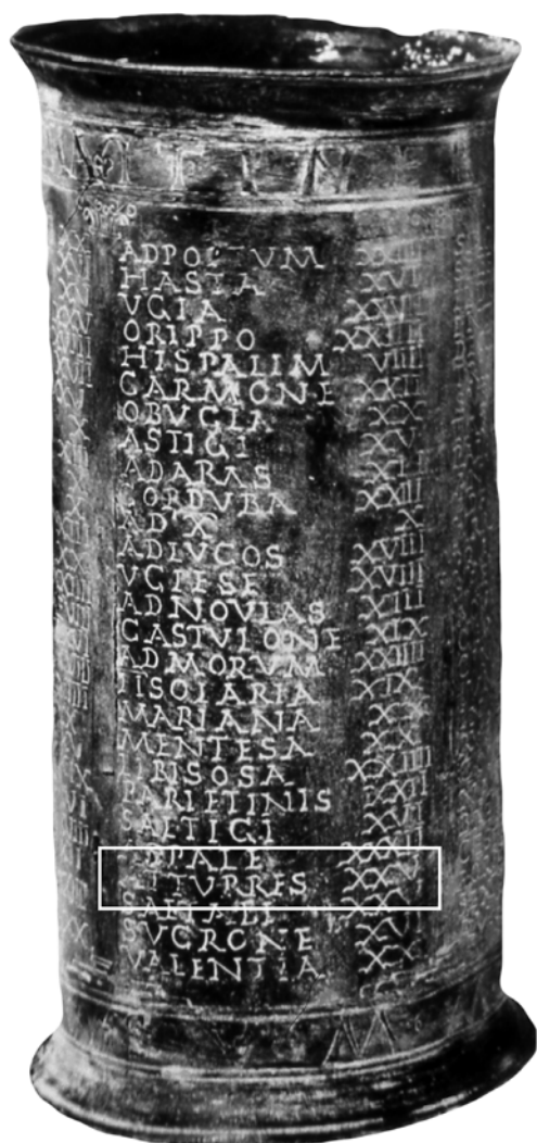
Figura 5. Un dels Vasos de Vicarello amb la menció de la posta Turres.

Sebastià, amb una superfície considerable. Sobre la distribució espacial d'aquestes instal·lacions, podem dir que la triple funció que devien acomplir com stabulum , horreum i hospitium (estable, graner i hostel) freqüentment es materialitzava en l'existència de tres complexos arquitectònics diferents (Corsi, 2000b). D'altra banda, en diferents punts situats a les rodalies de la població actual -els Cascallars, la Redonda, els Canyars (Pascual i García Borja, 2010: 316, fig. 6)- s'han trobat restes romanes corresponents a altres assentaments, que indiquen l'existència d'un poblament rural