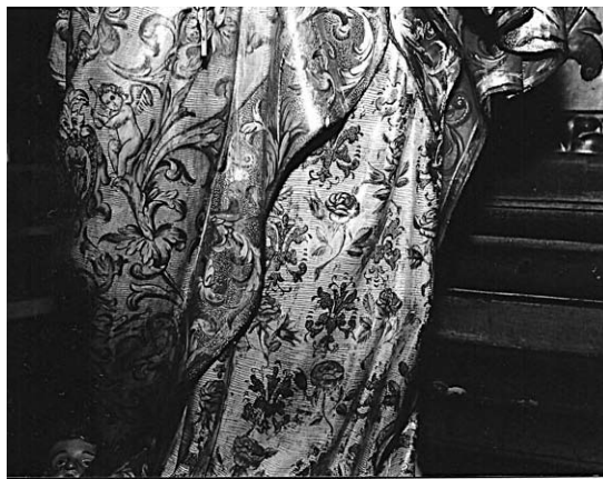
Fig. 2 izq. Retablo (desaparecido) de la antigua iglesia de San Andrés (hoy San Juan de la Cruz). Valencia. Dorado por Luis Campos.