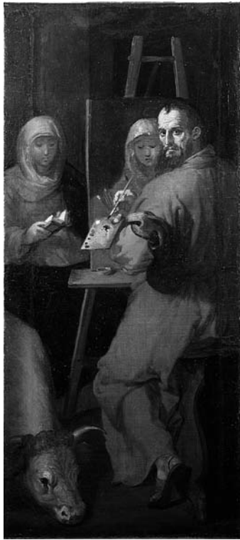
Fig. 1. Francisco Ribalta. San Lucas . Museo de Bellas Artes de Valencia.

genio, ignorada por los doradores por no haver subido aquel grado .