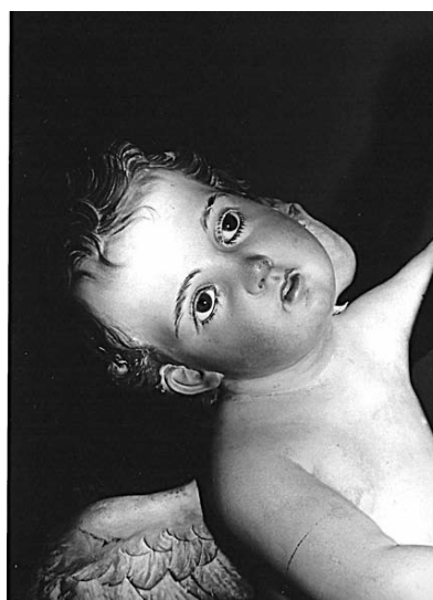
Fig. 5. Ignacio Vergara: Virgen de Portaceli . Detalle de angelito. Catedral. Valencia.

escultor, por madera, cervera y manos 3 libras y 10 sueldos y a su cuñado dorador , sin duda Francisco Lores, por oro y manos 4 libras y 10 sueldos. Nos parece muy verosímil que Lores ayudara con frecuencia a su cuñado escultor, repitiéndose así una colaboración familiar común a otros artistas.