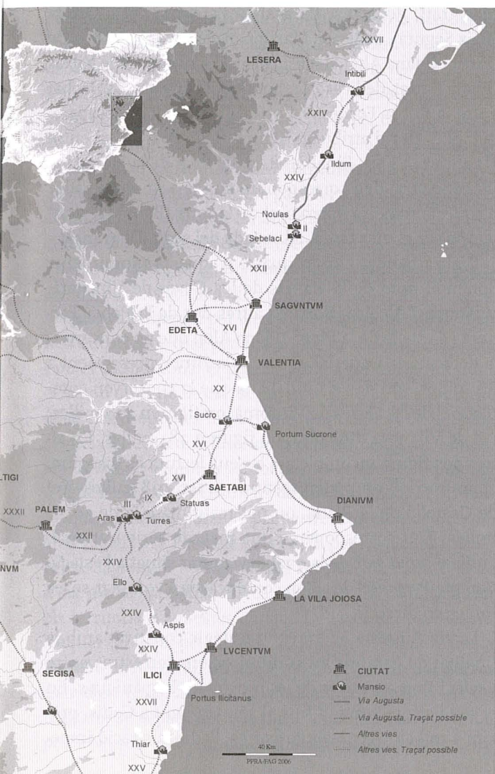
Mapa del País Valencià amb el traçat de les principals vies romanes, les postes i les distàncies que les separaven en números romans.

El mapa viari d'època romana al País Valencià es coneix a través de les notícies proporcionades pels itineraris, els mil·liaris conservats i les restes arqueològiques conegudes. De manera general poden identificar-se diferents tipus de vies, segons la importància i la funció, que podem definir com de caràcter estratègic, regional i local, que en conjunt dibuixen una xarxa viària de considerable densitat. El seu traçat respon a les necessitats de l'administració romana en relació amb una determinada distribució del poblament entre els segles I i IV, però els principals eixos viaris prefiguren amb prou exactitud el que serà el mapa de les comunicacions terrestres que ha anat desenvolupant-se des de l'edat mitjana fins a l'actualitat.