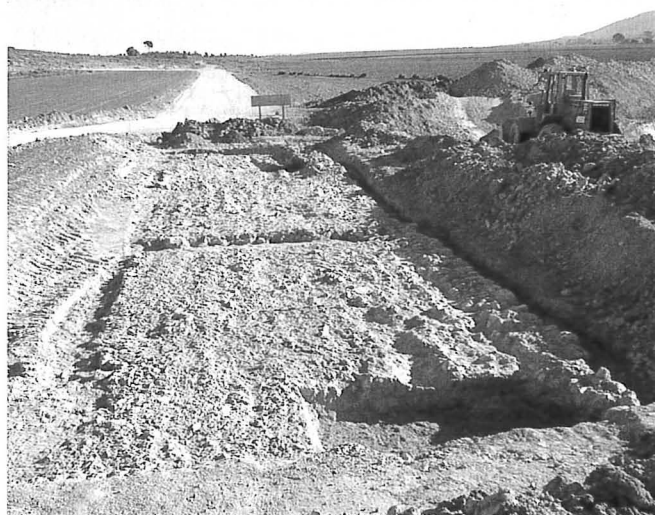
Excavació de la via Augusta entre la Pobla Tornesa i Vilafamés (Plana Alta), on es pot veure un dels umbones o vorades de la calçada.