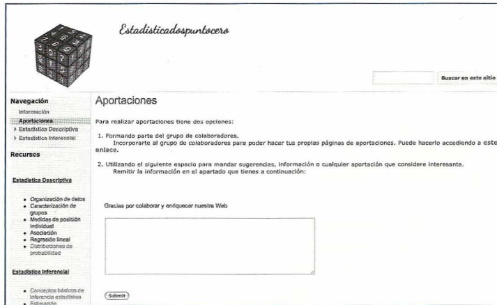
Figura 1. Aportaciones, Fuente: Elaboración propia

Tras haber decidido los contenidos y su posterior ubicación, entramos de lleno en la tercera fase. Ésta consistió en estructurar estos contenidos en función del temario de la asignatura Estadística del Grado de Psicología. Para este fin, diferenciamos dos grandes bloques, estos son: "Estadística descriptiva" y "Estadística inferencial". Dentro de cada uno de ellos, desglosamos los temas correspondientes y los conceptos más importantes de cada apartado y, posteriormente, adecuamos los Applets pertinentes para poder explicar mejor los contenidos que nos ocupan. En algunos casos, encontramos varios Applets para explicar un solo concepto y, en otros, un solo Applet nos sirve para clarificar distintos conceptos.