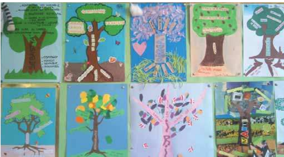
Imagen 6. Árboles diseñados por el alumnado de 3.º de primaria para exponer sus actitudes, los buenos hábitos y los que se pueden mejorar

Apostamos por la creación y difusión de imágenes mediante la fotografía, el vídeo, internet o cualquier otra tecnología de la comunicación , las cuales han de estar presentes en nuestra apuesta por una educación en artes visuales que favorezca el acercamiento a las identidades y también nos anime a reflexionar sobre nuestras propias realidades. ■