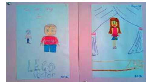
Imagen 5. Retratos de los niños de primaria realizados por ellos mismos

Encarna y Júlia nos comentan que su alumnado se muestra muy motivado cuando explica en clase estos dibujos, ya