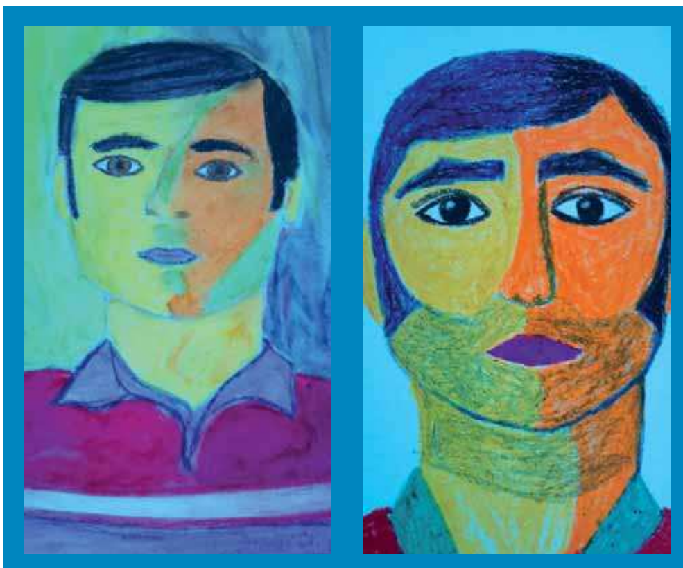
Imagen 2. Dibujos del alumnado de magisterio de educación primaria que retratan el rostro de su profesor

«cara» a un grupo, de dar visibilidad al conjunto proporcionándole una imagen; de este modo, se indaga de manera crítica en la falta de representaciones identitarias que padece el colectivo docente.