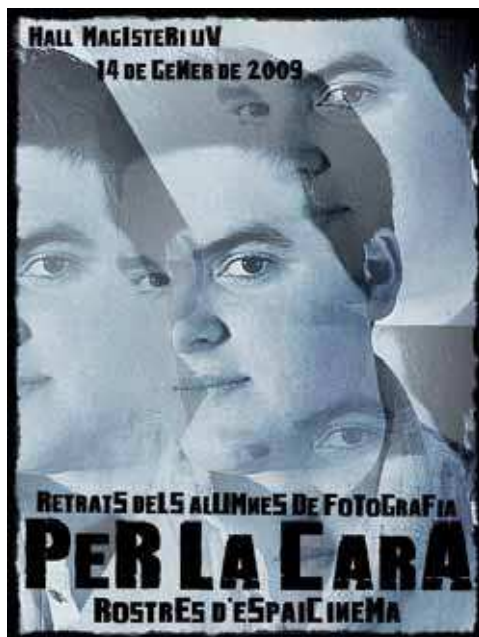
Imagen 1. Cartel realizado por Encarna Hernández para una de las muestras que se han organizado con retratos del alumnado de magisterio