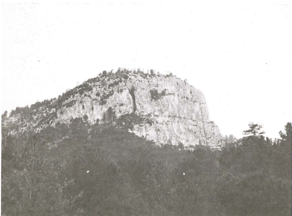
Fig. 4. — La Peña Parda (Cinctorres).