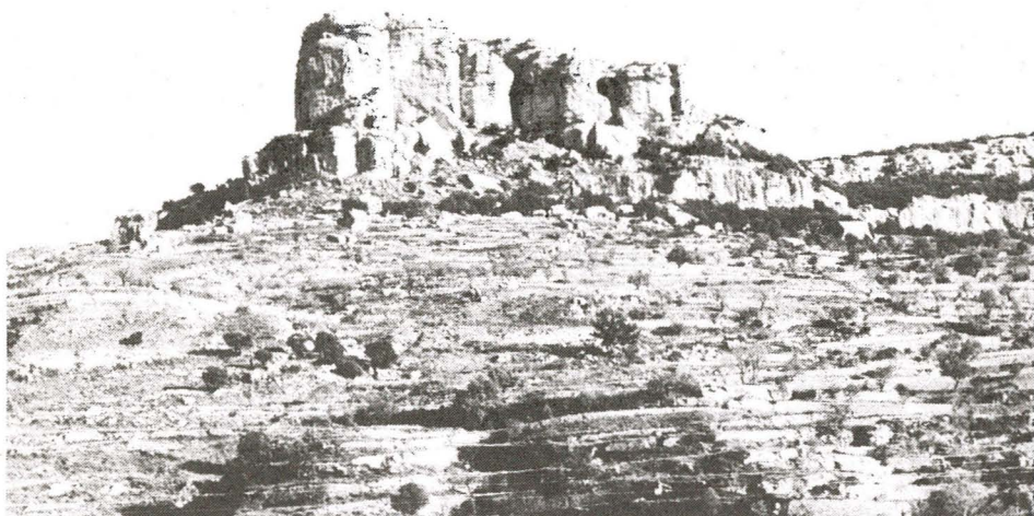
Fig. 3. — La Roca del Migdia (Morella).