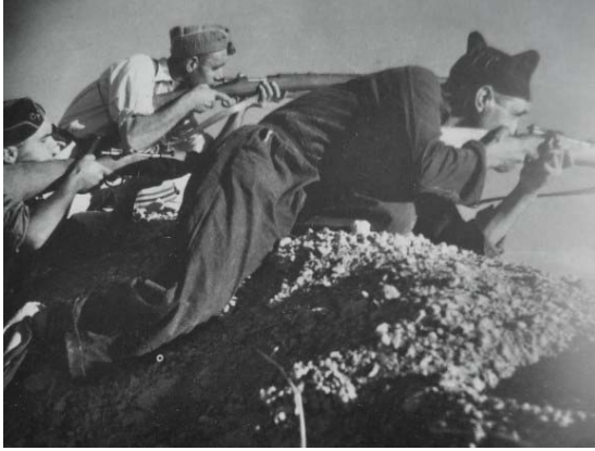
1. Milicianos republicanos con fusiles disparando contra el enemigo (Robert Capa)