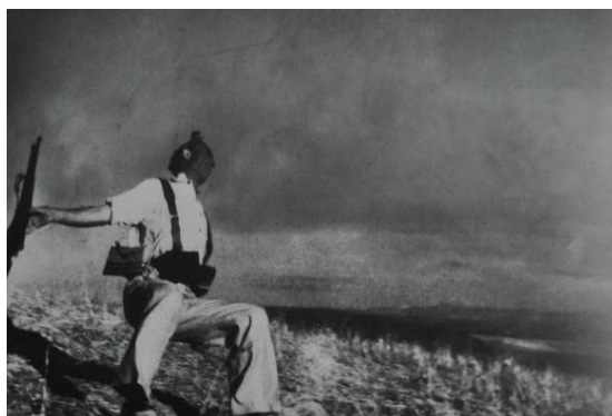
3. Guerra de España, miliciano muerto (Robert Capa)

Ambas imágenes fueron tomadas en agosto de 1936 y muestran una temática idéntica: una situación en el frente. La primera, atribuida a Robert Capa, es la popularmente conocida como el Miliciano muerto , mientras la segunda, realizada por Gerda Taro, ha sido titulada como Soldados republicanos con artillería .