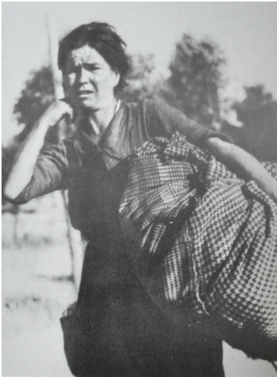
5. Refugiados en el frente de Córdoba (Robert Capa)

Cabe comenzar distinguiendo los formatos, pues la fotografía número 5 es rectangular, mientras la siguiente es cuadrada, lo que ayuda a clarificar la autoría, puesto que era Gerda quien utilizaba la Rolleiflex de negativos cuadrados, mientras Capa hacía uso de la Leica, en formato rectangular.