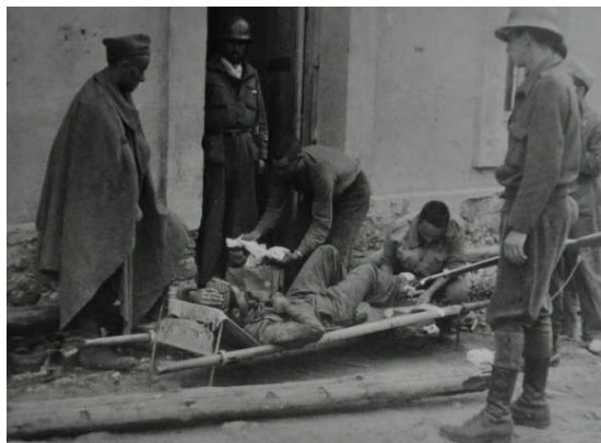
9. Hombres con un soldado republicano herido en una litera. 1938 (Gerda Taro)

Otras imágenes tratan sobre los heridos de guerra desde diferentes puntos de vista. Gerda Taro muestra el compañerismo y camaradería de los republicanos, ayudando a un compañero herido, mientras Capa prima la espectacularidad de una cruda imagen que pocas veces se vería publicada en un medio de comunicación, como es un hombre clavado en un árbol. El rostro de sufrimiento del retratado, su boca abierta pidiendo auxilio, su cabeza inclinada hacia atrás retorciéndose de dolor y sus brazos tensos agarrándose a las ramas, suponen un aliciente a la hora de captar la atención del lector. Ambas fotografías, a pesar de ser de actualidad en el momento en que se captan, se consideran atemporales, por el hecho de que ocurren con frecuencia. Especialmente llamativo e impactante es el caso de la foto número 10, una escena que se daba muy a menudo, donde paracaidistas cuyos artefactos fallaban en el último momento, caían irremediabilmente sobre árboles y casas, aunque pocos fotógrafos pueden presumir de haber captado la imagen en el mismo instante.