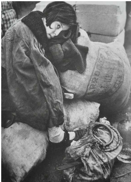
7. El avance de las tropas franquistas provoca el éxodo de miles de republicanos españoles hacia Francia, en este caso, se trata de una niña de Barcelona y su familia, que espera descansando en un centro de tránsito de refugiados a ser evacuada

Sin embargo, Gerda retrata a unos niños huérfanos que, aparentemente ajenos a su situación – quizá la más difícil para un niño, como es encontrarse de la noche a la mañana solo, sin ningún familiar con quien poder convivir–, se encuentran jugando animadamente con una pelota en el patio de un orfanato.