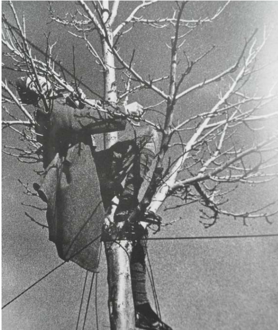
10. Sin descripción. Se ha catalogado como Batalla de Teruel, 1938 (Robert Capa)

Por su parte, Taro enfoca de una forma radicalmente distinta el tema de los heridos. La joven logra captar el compañerismo de los combatientes que han sufrido algún tipo de lesión o herida, sin necesidad de mostrar escenas de impacto o sangrientas, lo que hace que la imagen sea menos llamativa a nivel visual que la de su compañero.