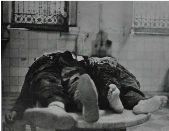
12. Víctimas de un bombardeo aéreo en el depósito de cadáveres (Gerda Taro)

Cabe destacar las diferencias entre ambas instantáneas, puesto que la de Capa, creada sobre la diagonal principal, crea sensación de equilibrio, pero también tensión. Justo al lado tenemos la fotografía de Taro, creada a partir de las líneas horizontales de la imagen, que ofrecen estabilidad y reposo, sensación que se combina con la de desasosiego, gracias a la toma que capta de los fallecidos. El hecho de ofrecer sólo un detalle de los pies de los cadáveres, de los que no ofrece en ningún momento su rostro, contribuye a crear curiosidad en el espectador y muestra, de una forma sencilla y sutil el tema de su fotografía: la muerte, sin artificios y sin necesidad de dar detalles o mostrar sangre, al tiempo que da constancia de la fragilidad de las personas.