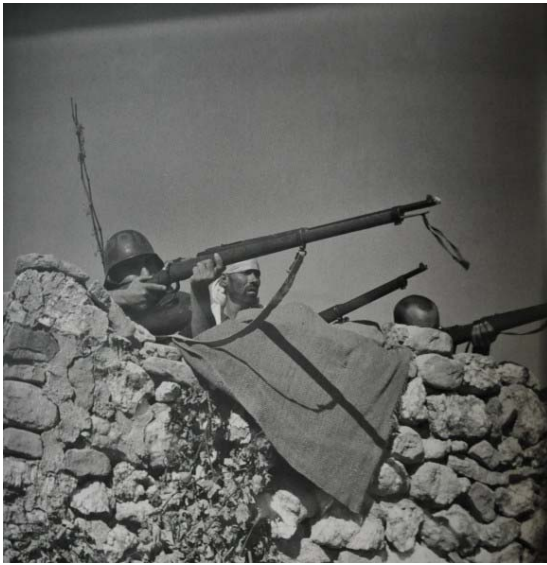
2. Soldados republicanos apuntando desde una barricada en el frente de Aragón (Gerda Taro)

Ambas imágenes se tomaron en agosto de 1936. La primera, atribuida a Capa, podría corresponder, según algunos expertos, a Cerro Muriano (Córdoba), mientras la segunda, realizada por Gerda Taro, la ubica en el Frente de Aragón.