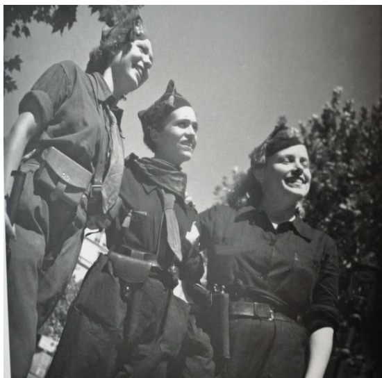
6. Tres milicianas republicanas (Gerda Taro)

Por otro lado, la foto de Gerda Taro parece haber sido realizada desde muy cerca –al contrario que la de Capa, que se sitúa a una distancia intermedia– y la estructura mediante la diagonal principal, lo que ayuda a crear movimiento. También cabe decir que tiene el horizonte un poco torcido, posiblemente por la inexperiencia de la joven en aquel momento o fruto de la rapidez con la que se quiso captar este entrañable momento entre tres jóvenes milicianas que charlan y posan animadamente. Sus desenfadados rostros, su sonrisa y su esperanzadora mirada crean una imagen distendida, dentro de la complicada situación que se vivía en España en dicho periodo. El efecto contrapicado de la imagen hace más grandes a sus protagonistas, en un símbolo de fortaleza contra las adversidades, tratándolas como auténticas heroínas. Incluso, se podría decir que la foto se toma desde un punto de vista de sumisión y admiración por parte de Taro que, tal y como explican sus biógrafos, refleja su entusiasmo por la milicia popular voluntaria en las personas “contundentes y recortadas” en sus imágenes, especialmente en el caso de las féminas que deciden convertirse en milicianas en un momento tan convulso.