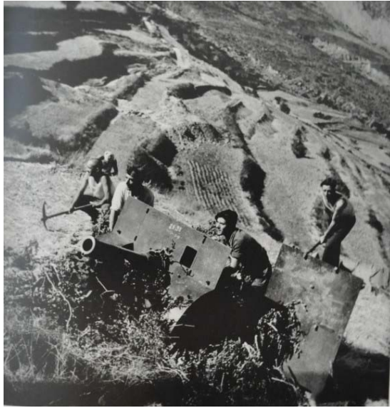
4. Soldados republicanos con artillería (Gerda Taro)

A simple vista, comprobamos diferencias en la orientación de la fotografía. La de Capa se orienta hacia la derecha, en el sentido de la lectura, lo que ofrece una sensación de continuidad. Además, el personaje se encuentra ubicado en el tercio inferior izquierdo, dejando lo que se conoce como aire en gran parte de la imagen. La composición por debajo de la diagonal principal contribuye a crear tensión y movimiento.