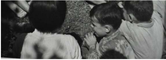
8. Huérfanos de guerra sentados en círculo (Gerda Taro)

Son dos formas de transmitir sensaciones a través de un mismo tema, como es un día en la vida de los más vulnerables de España entre 1936 y 1939. En ambos casos ocurre algo similar: los niños fotografiados son conscientes de la presencia de los fotógrafos, aunque en la imagen de Capa, la niña dirige su mirada a la cámara, mientras en la de Taro, los protagonistas juegan sin mirar en ningún momento a la fotografía. Una frase del conocido fotógrafo de la Agencia Magnum Martin Parr dice que “cuando el modelo te mira y no es una foto robada, casi nunca funciona”. Esta podría ser la máxima de Taro, que cuenta con distintas imágenes sobre la infancia en la que los niños aparecen en espontáneas escenas de juegos y diversión, pero prácticamente nunca en retratos mirando a cámara.