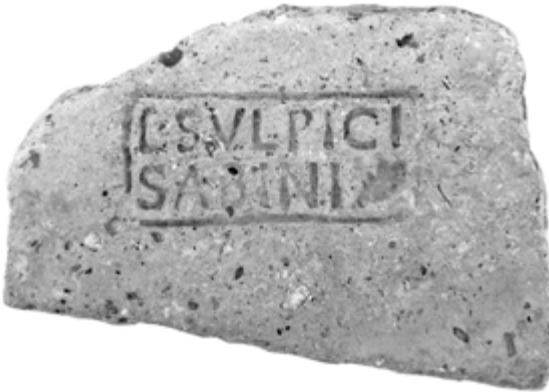
L(uci) Sulpici Sabini (palma) (?)