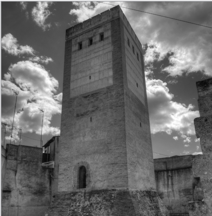
Torre de Canals.