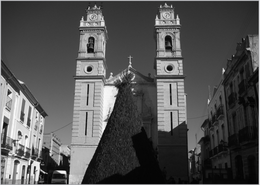
Iglesia parroquial Sant Antoni Abat. Canals.