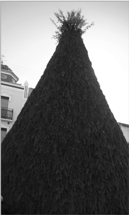
Fogueres de Sant Antoni Abat.

Por ello, son cada vez más las voces que advierten del peligro de prestar una excesiva atención al "desarrollo" socio-económico como un objetivo primordial que la conservación del patrimonio supone, y defienden que es crucial la salvaguarda de los mayores elementos patrimoniales posibles, con independencia de los beneficios inmediatos que esto pueda producir a las comunidades locales, ya que es un activo fundamental que garantiza el desarrollo de las generaciones futuras. Lo que se requiere es probablemente una combinación de los dos enfoques, que no son exclusivos, por un lado, aquello que reafirma el valor cultural del patrimonio al hacer más explícita su contribución a la sociedad en términos de bienestar y felicidad, y, por otro lado, la consideración del patrimonio como una potente herramienta para la conservación del medio ambiente, la sostenibilidad social y económica, ocupando un lugar prioritario en las agendas locales, nacionales e internacionales. Entre los objetivos que pueden vehicular esta relación de beneficios mutuos se halla la promoción de las capacidades locales para la conservación y la gestión del patrimonio cultural, en lugar de buscar la formación de nuevos talentos procedentes de otros lugares (Unesco, 2013), algo que es totalmente aplicable a otros ámbitos.