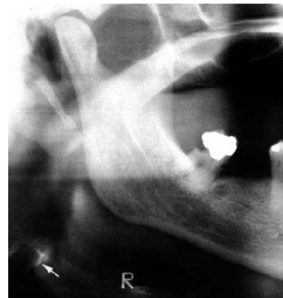
Fig. 2. Ortopantomografía que ha sido cortada, escaneada y digitalizada para realzar el proceso aterosclerótico. Se observan dos líneas verticales radiopacas (flechas).