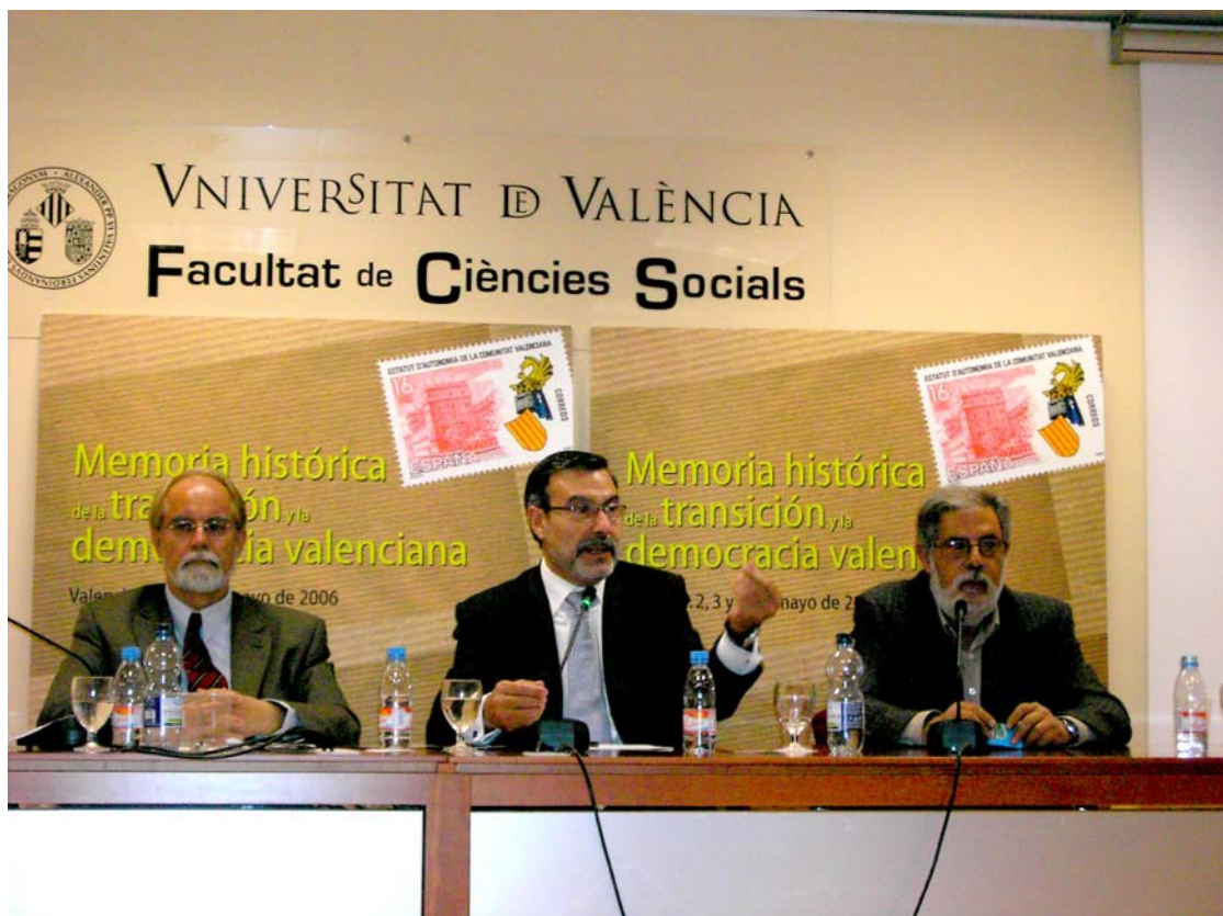
Vista general de una de las sesiones del curso en el salón de Grados de la Facultad de Derecho