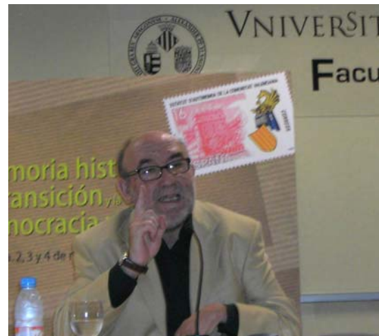
El catedrático de la Universidad de Valencia, y ex Diputado al Congreso Emerit Bono Martínez, intervino sobre Las negociaciones del Estatuto valenciano .