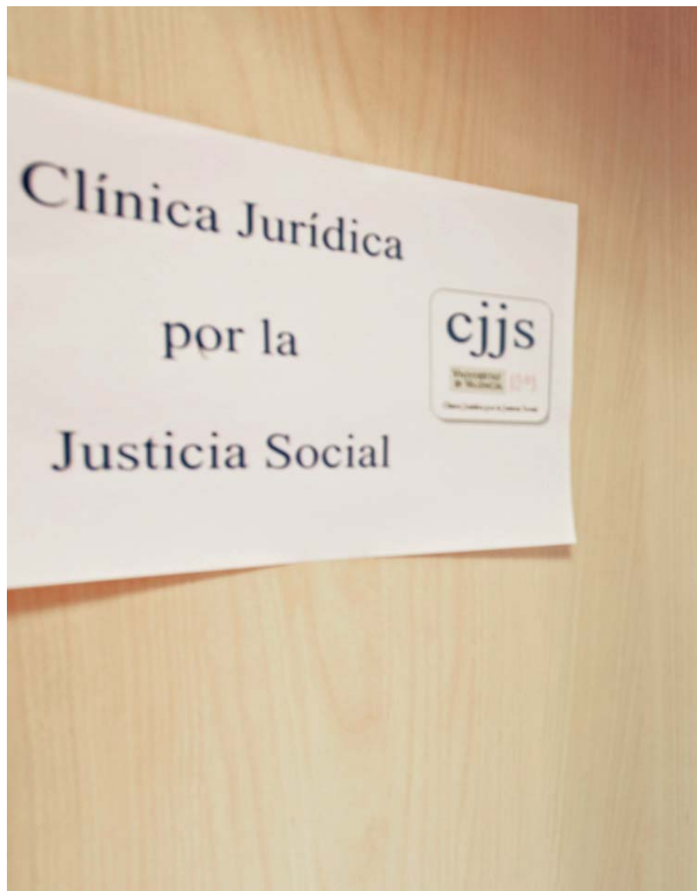
Noves instal·lacions de la Clínica Jurídica amb un grup de professors que han impulsat aquest projecte.

Abans de treballar en la Clínica, els estudiants reben una formació obligatòria específica. Així, es tracten temes de dret substantiu sobre estrangeria, violència de gènere o sistema penitenciari, i també qüestions sobre els procediments per a elaborar un expedient, com entrevistar-se amb un client, deontologia professional, etc. Una vegada complert aquest període, els