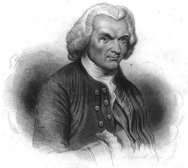
Fig. 1.- Retrato de J.J. Rousseau. En "Émile, ou de L'Éducation", Paris, 1857.

Así suele ser, más o menos, el agudo contraste entre aquella primordial forma de subsistir y el mundo de experiencias que configura el día a día de nuestra existencia en las ciudades, los núcleos demográficos constitutivos del mundo industrializado. Tamaña ignorancia de cómo subsistimos todos los humanos hasta hace unos diez mil años y de cómo viven todavía determinadas tribus en algunos lugares de la tierra es una faceta característica que nos define a millones de personas en la actualidad. No obstante, este predominio de la vida ciudadana, reforzado por el enorme número de quienes la compartimos y la orgullosa sensación de normalidad y de progreso que solemos manifestar, impide que caigamos en la cuenta de la excepcionalidad que significa y de los riesgos que conlleva en la ya larga persistencia de nuestra especie: bastaría para tomar conciencia de ello que retrocediéramos en el tiempo, o que nos desplazáramos a otras zonas del planeta, e hiciéramos una simple comparación. Este doble movimiento en el espacio y en la historia, atendiendo a quienes muestran su humanidad de forma tan diferente, es muy necesario y aleccionador si queremos saber qué somos, de dónde venimos, y hacia dónde deberíamos ir. Y lo es por una razón muy sencilla.