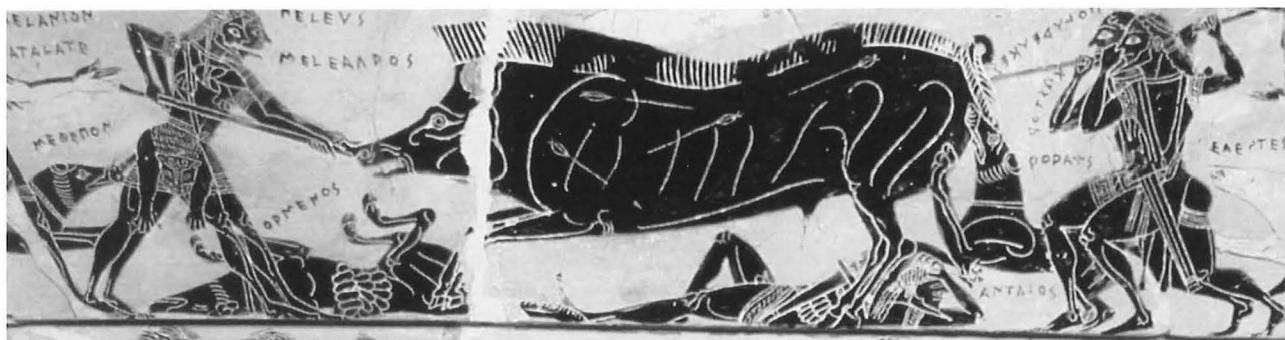
Fig. 2.- Crátera ática con escena de cacería de jabalíes. “Caza de Calidón”. Museo Arqueológico de Florencia.

de atar las amarras. Se puede permanecer allí, una vez arribados, hasta el día en que el ánimo de los marineros les impulse y soplen los vientos. En la parte alta del puerto corre un agua resplandeciente, una fuente que surge de la profundidad de una cueva, y en torno crecen los álamos. Hacia allí navegamos, llegamos a tierra, arrastramos las naves de buenos bancos, recogimos todas las velas y descendimos sobre la orilla del mar, y esperamos la aurora durmiendo sobre la arena. Cuando llegó la mañana, deambulamos llenos de admiración por la isla. Las cabras montaraces se agitaron, así que en seguida sacamos de las naves los curvados arcos y las flechas de largas puntas, y ordenados en tres grupos comenzamos a disparar, pronto tuvimos abundante caza. Así estuvimos todo el día hasta el sumergirse del sol, comiendo innumerables trozos de carne...”