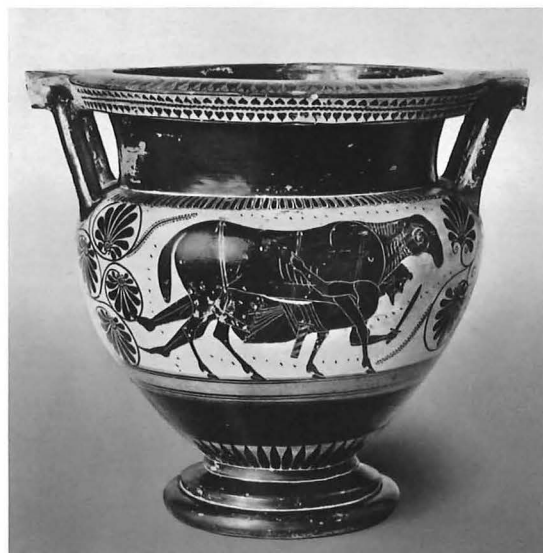
Fig. 3.- Crátera ática de columnas. Odiseo huyendo de la cueva de Polifemo. “Pintor de Safo”. Badisches Landesmuseum, Karlsruhe.

Como es evidente, en esa sociedad hay ganadería de diversos tipos, se han domesticado ya los bueyes y los caballos, que facilitan las labores de labranza y tiran de los carros en las carreras, pero dispone también sobre todo de la agricultura , por eso sus miembros se alimentan no sólo de carne, sino sobre todo de pan de harina de