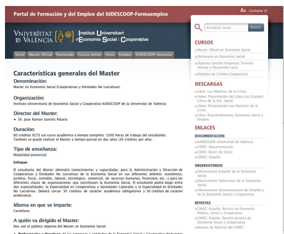
Figura 1. Portal formativo y del empleo del IUDESCOOP

La experiencia acumulada por el personal docente del máster y el doctorado en ESCES se apoya principalmente en la colaboración, como miembros en activo, del Centro de Investigación en Economía Pública, Social y Cooperativa, CIRIEC-España. Este centro es entidad colaboradora del máster y el doctorado en ESCES de la Universitat de València, proporcionando al personal del postgrado los materiales y la documentación disponible en sus instalaciones. Además, las dos revistas editadas por el CIRIEC-España, Revista CIRIEC-España 10 , de economía, y Revista Jurídica CIRIEC-España, están a la disposición del personal docente del postgrado para la publicación de trabajos relacionados con sus investigaciones y análisis académicos.