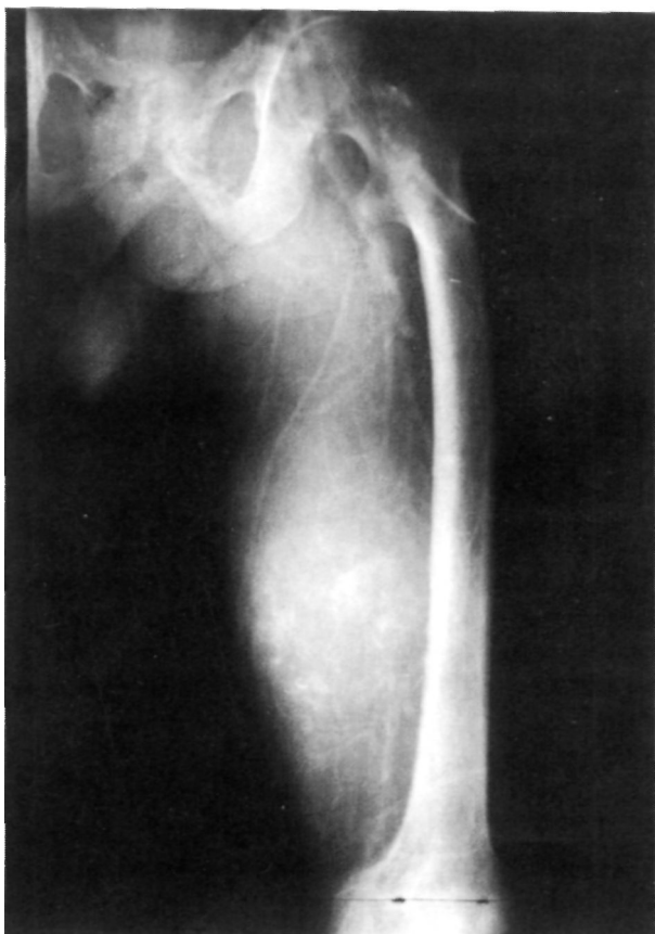
Figura 2. Fenómeno de «escape de contraste» intratumoral.

táneos y viscerales abdominales, existen otras localizaciones viscerales realmente anecdóticas como los comunicados en el pericardio o en el encefalo (10, 11).