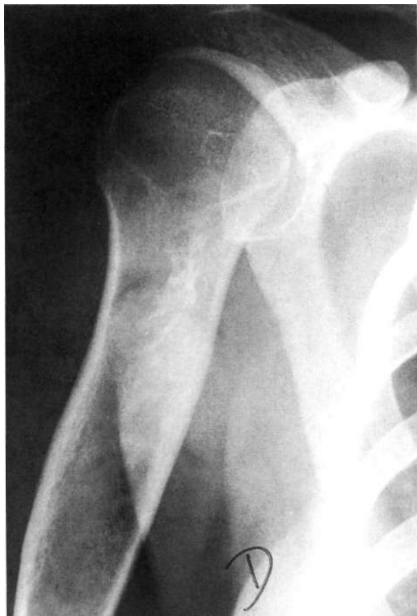
Figura 4. Resultado a los 19 meses.

En los 11 quistes óseos tratados mediante infiltraciones de corticoides hemos obtenido un 27,3% de curaciones completas (3 casos), un 45,5% de curaciones incompletas (5 casos), y un 27,3% de recidivas (3 casos), resultados inferiores a los comunicados por otros autores (1, 4, 13, 19, 20, 22, 23, 26, 32, 33). Tal vez podría deberse a defectos en la técnica quirúrgica que no garantizan la llegada del corticoide a la totalidad del quiste, sobre todo en quistes tabicados, por lo que se recomienda realizar una inyección intraquistica de contraste radiológico para identificar quistes tabicados, guiar la inyección de corticoides a todas las cavidades, y comprobar que éstas se han rellenado convenientemente (34).