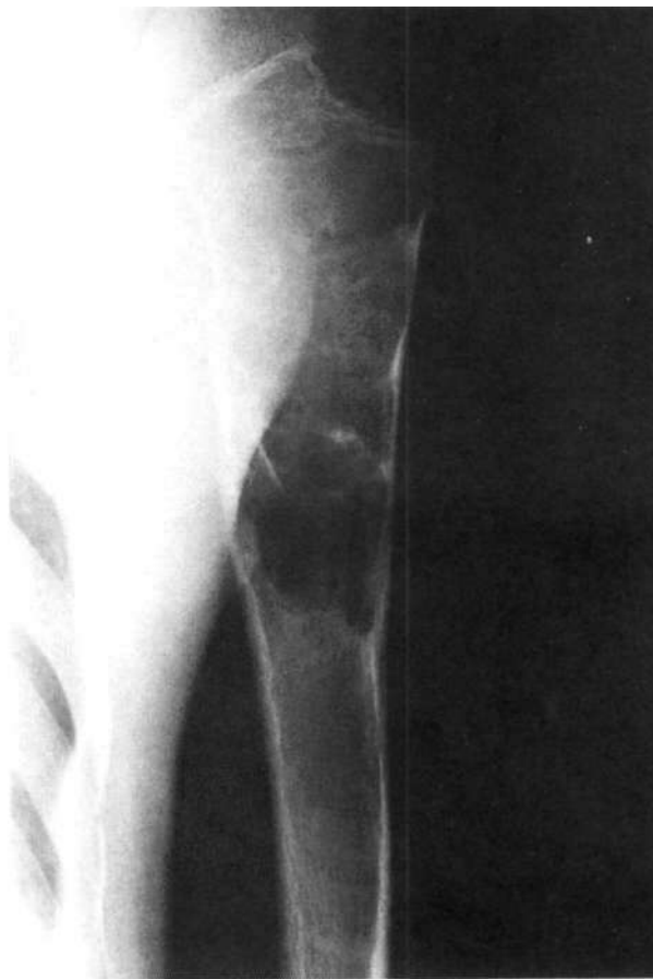
Figura 5. Quiste tratado con infiltraciones de corticoides.

Sin embargo, Hashemi-Nejad et al (24), también obtienen resultados pobres, incluso administrando contraste radiológico previo. Afirman que la respuesta de los quistes óseos a las inyecciones de corticoides es impredecible y habitualmente incompleta, incluso tras múltiples in-