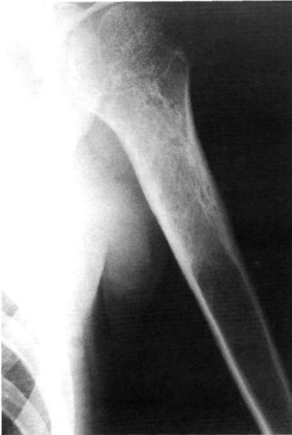
Figura 6. Resultado a los 20 meses.

Al igual que en la mayoría de las casuísticas publicadas (4, 5, 19, 21, 22), no hemos tenido complicaciones usando la técnica de Scaglietti, aunque se han descrito casos puntuales de varización y disimetría residual en posible relación con afectación del cartílago de crecimiento (1, 26, 32). El índice de complicaciones tras curetaje y relleno con injerto es bajo, pero supera claramente al del tratamiento con corticoides, siendo complicaciones derivadas del acto quirúrgico, tales como infecciones (19), disimetrías o incurvaciones residuales por lesión fisaria (4, 19), y cicatrices poco cosméticas (1), pero que nosotros no hemos observado. Otras complicaciones tras curetaje y relleno descritas por otros autores (4, 6), y también presentes en nuestra casuística, guardan relación con la técnica de obtención de injerto autólogo (dolor en la zona donante en un caso), y la inmovilización postoperatoria (rigidez del hombro y atrofia deltoidea en otro caso).