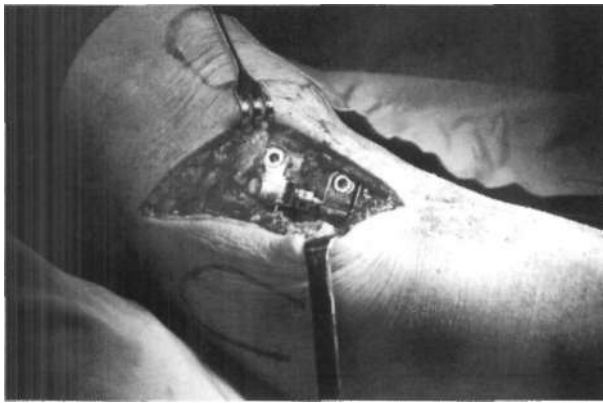
Figura 2. Imagen quirúrgica de la placa VCO colocada en la vertiente metafisaria lateral de la tibia tras realizar el cierre de la osteotomía. Se aprecia el escazo volumen del material.

27,3% del total de pacientes. Referente al dolor, el 13,3% lo presentaba con la actividad laboral, el 26,7% con actividades ligeras, el 53,3% con las actividades diarias no laborales y el 6,7% refería dolor de reposo. El uso de analgésicos era diario en el 62,5% de nuestros pacientes, con consumo semanal en el 12,5 % y ocasional en el 25%. La movilidad articular preoperatoria mostraba 97,5° de flexión (mín: 70; máx: 135°); extensión media de 177,5° (mín 170°; máx: 180°). Ningún paciente evidenció inestabilidad inicial.