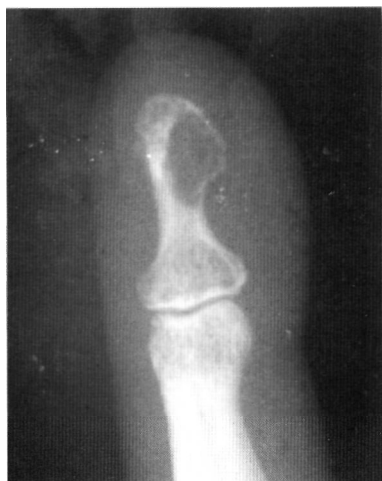
Fig. 1. Imagen radiográfica, en visión anteroposterior, de la falange distal del 4º dedo mostrando la lesión osteolítica.