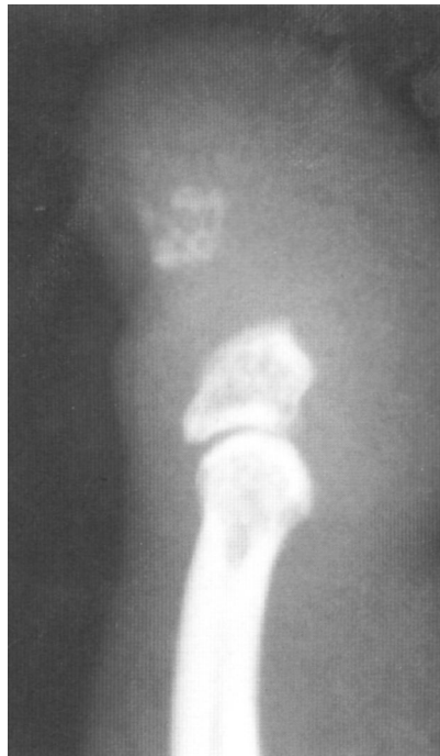
Fig. 3. Radiografía, en visión perfil, del dedo mostrando la falangectomía parcial.

El resultado fue bueno estando la paciente asintomática al año de la intervención. ■■■■■