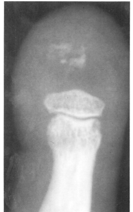
Fig. 4. Imagen radiográfica del dedo al mes de la intervención en proyección anteroposterior.