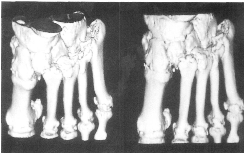
Fig. 6. TAC tridimensional de una fractura-luxación de Lisfranc tipo B externa.

Coincidiendo con García Rodríguez (30), en nuestra serie no hemos practicado artrodesis primaria alguna, que tampoco fue necesaria en un segundo tiempo hasta la