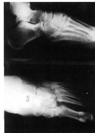
Fig. 2. Fractura-luxación de Lisfranc Tipo B externa.

Hemos seguido como criterio el tratamiento de urgencia, consistente en intentar una reducción cerrada con el paciente en decúbito supino bajo anestesia, realizando tracción con flexión plantar y supinación del antepié seguido de dorsiflexión y pronación, para posteriormente inmovilizar con una bota de yeso cuando la estabilidad y calidad de la reducción eran buenas (5 casos: 1 A ext., 2 B int., 2 B ext.). Cuando no era así, se procedía a la estabilización con agujas de Kirschner percutáneas (1 caso), y reducción abierta estabilizada con agujas de Kirschner si la reducción no era la adecuada o existía una importante conminución articular (10 casos). En los casos de reducción abierta se realizó siempre una incisión longitudinal a nivel del 1er ó 2° espacio intermetatarsiano, teniendo un especial respeto por la arteria pedía y los nervios sensitivos