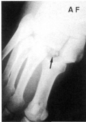
Fig. 5. Fleck sign (flecha).

dorsales. Si el tipo de lesión precisaba abordajes más externos se realizaron por vías paralelas a la mencionada. En ningún caso se realizó artrodesis ni de entrada ni en un segundo tiempo.