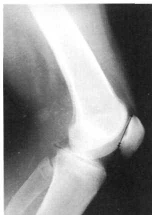
Fig. 1. Radiografía simple de rodilla izquierda en proyección lateral donde se aprecia el fragmento osteocondrítico en el tercio inferior de la rótula, observándose una línea radiolúcida que lo delimita claramente.