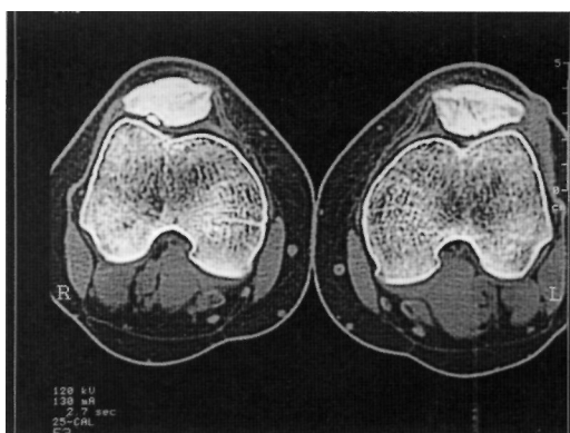
Fig. 5. TAC postoperatoria (1mes). Mejoría significativa en rótula izquierda, con persistencia del fragmento en la derecha.