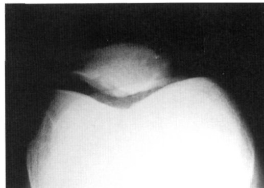
Fig. 3. Radiografía simple de rodilla derecha en proyección axial. Fragmento osteocondrítico en la carilla rotuliana externa.

se realizó miniartrotomía, se practicaron perforaciones con aguja de Kirschner y liberación del alerón rotuliano externo. A los tres meses, la paciente estaba clínicamente asintomática, mostrando la radiografía simple y la TAC la resolución del cuadro en la rodilla intervenida (Fig. 5 y 6), permaneciendo la rodilla derecha con los hallazgos iniciales. Tras un seguimiento de 4 años no se han presentado cambios clínicos ni radiológicos.