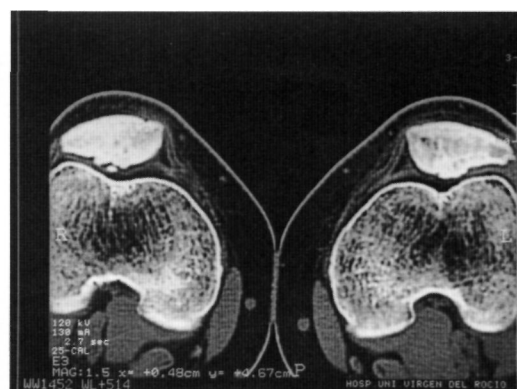
Fig. 6. TAC postoperatorio (3 meses). Desaparición de la lesión en rótula intervenida, sin cambios en la rótula derecha.