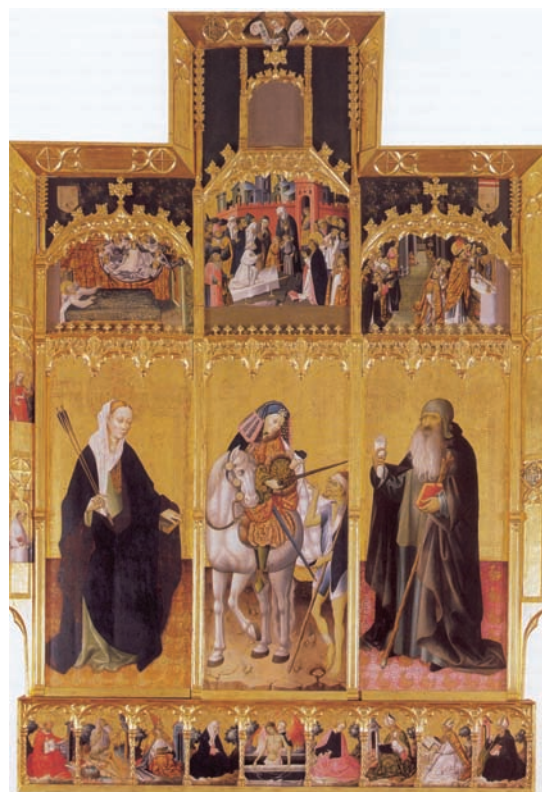
Fig. 6. Peris Sarrià, Gonçal: Retablo de san Martín, santa Úrsula y san Antonio Abad. ca. 1441, ténpera y oro sobre tabla, 385 x 261 cm., Museo de Bellas Artes de Valencia, Valencia.

Otro aspecto interesante, aunque con escaso respaldo documental en el Reino de Valencia, son los retablos cuya calle principal se destina a albergar una escultura, lo que implicaría aún más si cabe la maestría de un imaginero. Parece que es el caso del conjunto de Pere Nicolau y Marçal de Sas para la cartuja de Portaceli, según ha podido documentar Fuster Serra 98 . Pero es posible pensar en otros conjuntos que carecen de tabla principal, o de aquellos documentados en los que no se especifica si la tabla central debe pintarse, o estará ocupada por una escultura de la Virgen 99 .