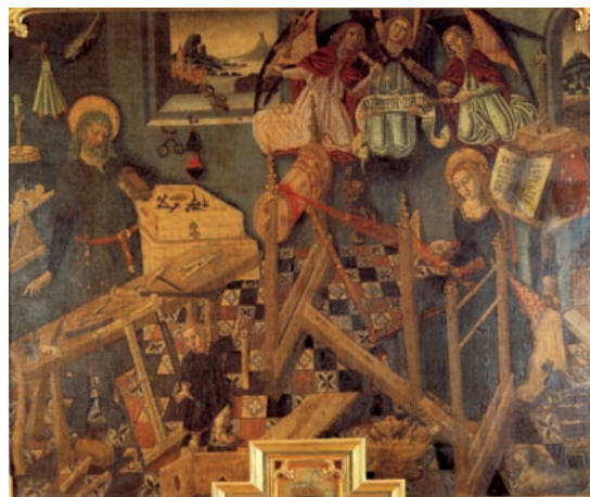
Fig. 1. Terrençs, Pere: Sagrada Familia, sarga, 1.42x 1.72 cm, fin. XV- prin. XVI, Colección particular. Ejemplo del interior del obrador de un carpintero.

Por otra parte, los retablos eran considerados como conjuntos integrados por tablas, entrecalles, pináculos, arquillos, un tabernáculo y fragmentos de otras figuras, aunque nuestra mirada acostumbra a fijarse en las piezas que se conservan como cuadros fragmentarios en museos y colecciones. En estas máquinas importaba, además del tamaño, la estructura de calles, entrecalles, predela o banco y sotabanco, guardapolvo, ático, etcétera y, en general, la disposición de las tablas que forman el conjunto, sometidas al orden arquitectónico que imponían los pináculos, los montantes, los gabletes y la tracearía. En la función religiosa y social del retablo cuentan también el número y prelación de las advocaciones, la proporción entre escenas narrativas o historias y figuras, la ostentación de la heráldica o la figura del donante y, en definitiva, cualquier variante en la combinación y presentación de las imágenes piadosas que constituían la función genuina de los estas obras.