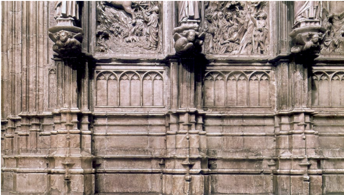
Fig. 5. DALMAU, Antoni: Trascoro de la catedral de Valencia, Capilla del Santo Cáliz, Catedral de Valencia.

Como cualquier otro artesano más de la ciudad con sus encargos, la talla y composición del retablo por parte del artista también era susceptible de quejas o de incumplimiento del contrato. El citado portal del coro en alabastro de Jaume Esteve fue considerado cuanto menos deslucido, según criterio del orfebre Bertomeu Coscolla y del arquitecto Pere Balaguer, y hubo de ser contratado años más tarde por Antoni Dalmau, un maestro más ducho en la talla en alabastro y el diseño, que había comenzado su actividad en la mazonería de retablos