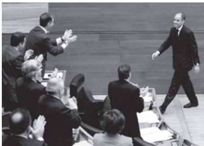
Jordi Vicent. El País 13/03/2009

Por el contrario, el plano en las fotografías de Camps se abre. El president se inserta en una realidad mayor (únicamente en 8 ocasiones aparecerá solo). Se busca las reacciones de su grupo y éstas no defraudan a los intereses del jefe. A pesar de la ausencia de sorpresa, estas imágenes de la claque popular se reiteran a lo largo del periodo estudiado.