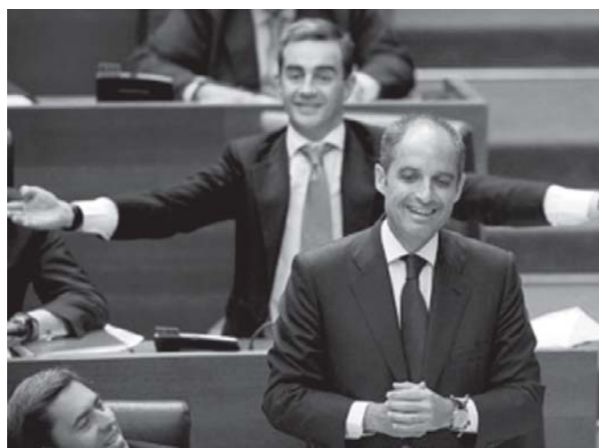
EFE. El País y El Levante 1/05/2009

Junto al respaldo mayoritario, el otro elemento de la imagen popular será la euforia con la que restar importancia a la gravedad que los Otros intentan imponer a los hechos. Las sonrisas y los aspavientos son otra de las máximas incorporadas al discurso fotográfico.